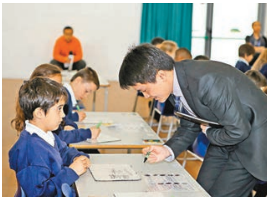
■ 讓教師成為令人羨慕的職業，確立作為國家公職人員的法律地位。圖為中國數學老師在英國進行教學交流。資料圖片

意見圍繞全面加強師德師風建設，不斷提升教師專業素質能力，深化教師管理綜合改革，不斷提高教師地位待遇，確保政策舉措落地見效等方面