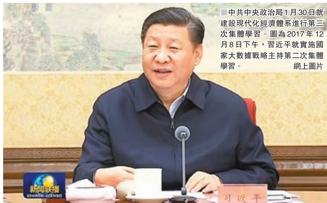
■ 中共中央政治局1月30日就建設現代化經濟體系進行第三次集體學習。圖為2017年12月8日下午，習近平就實施國家大數據戰略主持第二次集體學習。網上圖片

要建設資源節約、環境友好的綠色發展體系，實現綠色循環低碳發展、人與自然和諧共生，牢固樹立和踐行綠水青山就是金山銀山理念，形成人與自然和諧發展現代化建設新格局。要建設多元平衡、安全高效的全面開放體系，發展更高層次開放型經濟，推動開放朝着優化結構、拓展深度、提高效益方向轉變。要建設充分發揮市場作用、更好發揮政府作用的經濟體制，實現市場機制有效、微觀主體有活力、宏觀調控有度。以上幾個體系是統一整體，要一體建設、一體推進。我們建設的現代化經濟體系，要借鑒發達國家有益做法，更要符合中國國情、具有中國特色。