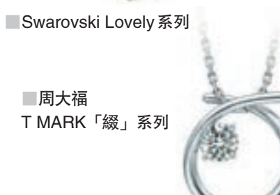
Swarovski Lovely 系列

另外，荷蘭手錶品牌CLUSE以簡單利落的設計著稱，新推出的珠寶飾品、時尚腕錶、禮品套裝現於指定時間獨家發售。今年情人節特別推出手錶與首飾合一的Minuit Heart!禮盒，Minuit鋼帶手錶以玫瑰金、金色或銀色為主，再配上心形吊牌手錶，代表着慶祝的意思，為活在當下而感恩。