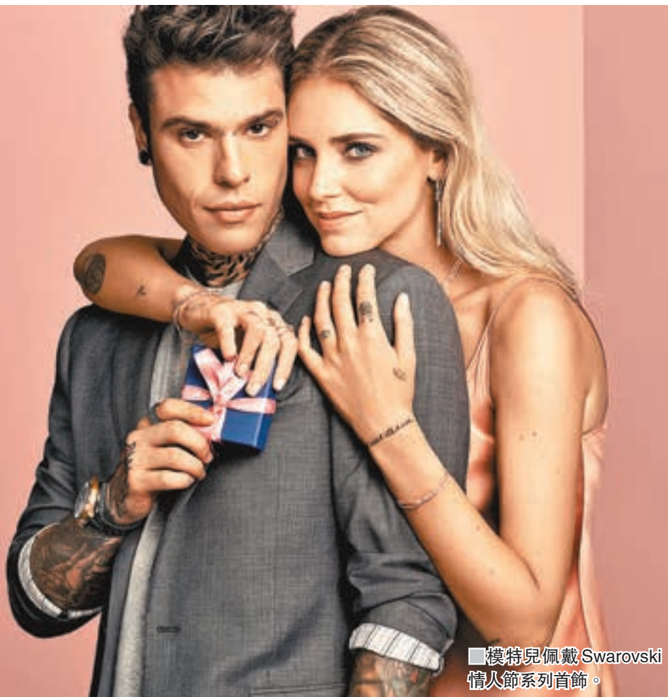
模特兒佩戴Swarovski情人節系列首飾。