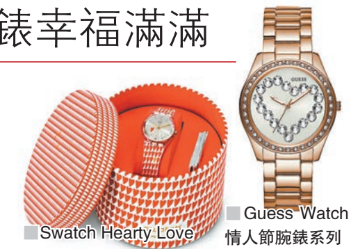
Swatch Hearty Love 及 Guess Watch 情人節腕錶系列

情人帶來祝福和喜悅，奪目的幾何心形圖案，糅合巧妙創意與實用功能，讓情人節滿載浪漫驚喜。其瑰麗獨特的包裝下，是全球限量發行 7,654 枚，香港限售 240 枚的手錶，每枚均刻有編號。白色圓盒表面灑滿片片紅心，呼應 HEARTY LOVE 錶帶的印花。