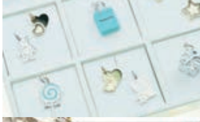
以 Tiffany 著名藍色盒子、購物袋及情信為創作藍本的各款吊飾。