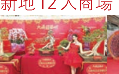
Just Gold 心連心系列