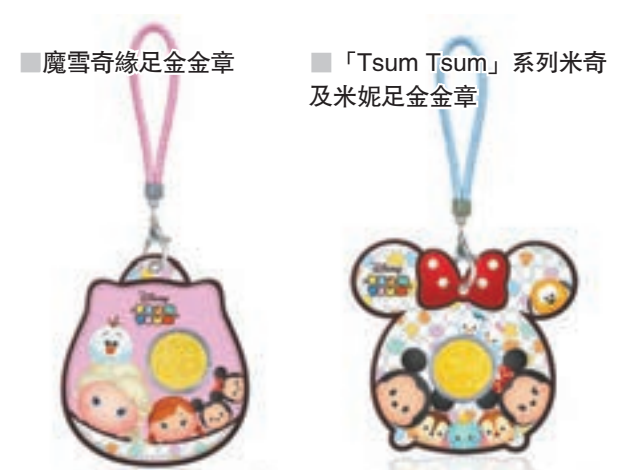
魔雪奇緣足金金章 「Tsum Tsum」系列米奇及米妮足金金章

品牌亦特別推介迪士尼「Tsum Tsum」系列、迪士尼小熊維尼系列，以及「周大福 X 林文傑系列」特色工藝產品，一班迪士尼好友米奇、米妮、高飛以及魔雪奇緣家族，聯同小熊維尼要同大家拜年，有五款足金金章，每款均配以獨立包裝，其中以紅封包包裝的迪士尼「Tsum Tsum」系列金章更專為狗年而設，以米奇及高飛為主角，用作新年送禮就最好不過，必然成為大人、小朋友喜愛的新年禮物。