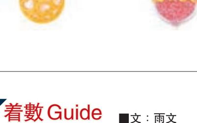
景福珠寶「愛·相隨」系列