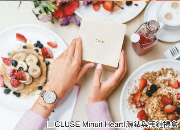
CLUSE Minuit Heart! 腕錶與手鏈禮盒

作為情人節的代表性圖案，心形在Swarovski今季的全新Lovely系列以清新亮麗的面貌登場，在熠熠生輝的密鑲品牌水晶的襯托下，開口的心形設計散發出濃濃愛意，與其他首飾搭配時又為裝扮注入前衛型格的氣息，如簡約利落的Attract短項鏈，其閃亮迷人的水滴形鑽石垂飾，不但讓這個搭配組合女人味十足，而且極具現代感。