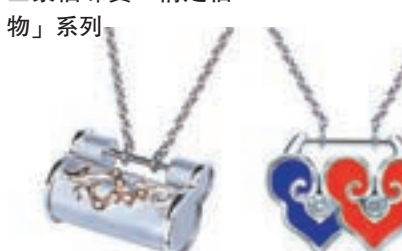
周大福 T MARK「綴」系列