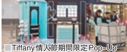
Tiffany 情人節期間限定 Pop-Up