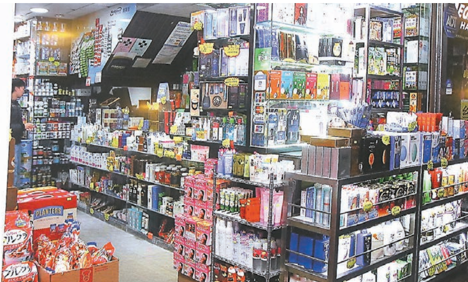
■涉嫌出售冒牌中成藥的旺角區藥房。