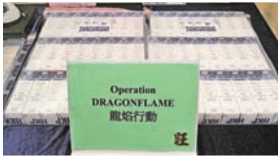
■「龍焰」掃黃行動檢獲大量潤滑劑。