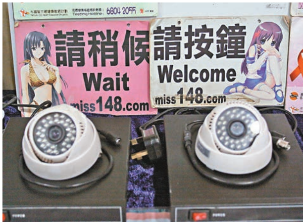
■劏房由黑幫操控出租予「鳳姐」搵客。

警方透露，近百名涉嫌賣淫女子，當中59名為內地女子（18歲至33歲），全部持雙程證來港；17名俄羅