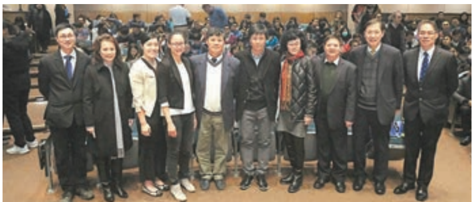
■體育界聯同港協暨奧委會昨日舉行體育界消除歧視及防止性騷擾研討會。