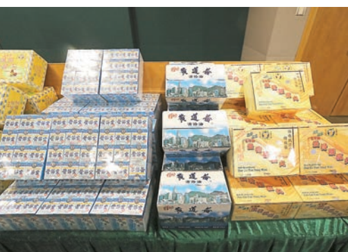
■檢獲的冒牌風濕藥、痛風藥及活絡油市值約50萬元。