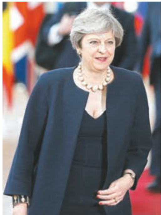
■ 英國首相文翠珊將於31日起展開對中國的三天訪問。 資料圖片