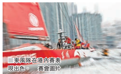
東風隊在港內賽表現出色。

Volvo Ocean Race環球帆船港內賽日前結束，綜合香港兩場比賽成績，代表中國參賽的東風隊奪得冠軍。在27日的首場較量中，荷蘭船隊阿克蘇諾貝爾隊奪得冠軍，東風隊以第二名的成績完成比賽。而28日的環島賽，西班牙船隊曼福隊率先衝過終點，東風隊位列第二。兩場比賽東風隊總分最高，獲得香港的港內賽冠軍，曼福隊和阿克蘇諾貝爾隊分獲亞季。