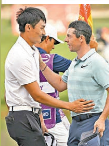
李昊桐(左)接受麥基爾羅伊的祝賀。