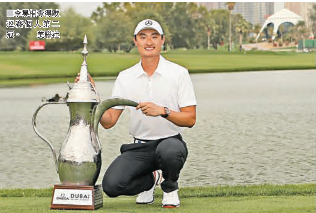
李昊桐捧起歐巡賽個人第三冠。