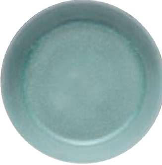
香港蘇富比北宋汝窯天青釉洗成交近3億

回顧去年的成果，我們可以一窺2018年的市場風向，有理由相信，更好的業績，更大的收穫，更高的價位將貫穿今年的市場。