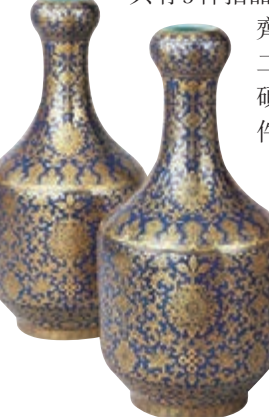
廈門保利藍地金彩蒜頭瓶一對3,586萬落槌

東京中央香港秋拍，其中王蒙《泉聲松韻圖》破億，以1.7億的成交額成為史上按平尺算最貴的古畫。高達4米的王鐸書法也以2,240萬成交。北京保利秋拍以逾52.68億總成交額交出完美答卷，本次拍賣共有5件拍品成交破億，包括齊白石《山水十二條屏》、吳昌碩《花卉十二屏》等，40件成交超千萬元。北京嘉德秋拍亦有多件衝破億元關口拍品，當中以沈周《送吳文定行圖並題卷》成績最好，以1.83億成交；第二位，張大千《江堤晚景》以1.63億成交。有以上去年成功奠下基礎，今年市場一定會更好。