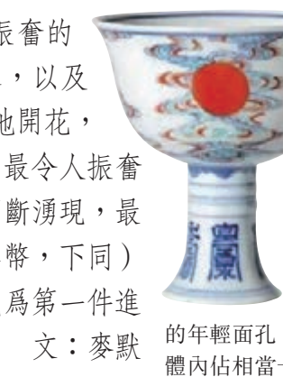
北京中貿聖佳雍正門彩「五色慶雲光燦捧日」聖壽如日方中高足杯逾1,137萬成交

北京中貿聖佳有兩件雍正官窯頗受矚目。其中之一是雍正7年萬壽節，宮廷特別精心定製了門彩「五色慶雲光燦捧日」聖壽如日方中高足杯，可以說這樣的御瓷已經不是簡單的宮廷用器了，而是承載了一代帝王所有的政治抱負，歷史價值和文物價值自然非同尋常了，因此錄得了逾1,137萬成交。另一件，雍正御製瓷胎洋彩珐琅春風碧桃圖膽瓶，完美地體現了雍正官窯品位。雍正對於瓷器的紋樣畫稿極為重視，從膽瓶的畫意看顯然深得宋人寫實花鳥畫之精髓，同時也融入了