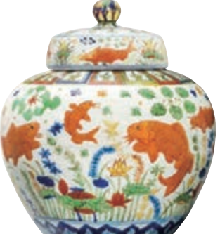
香港佳士得明嘉靖五彩魚藻紋蓋罐2.13億成交

2017年海內外中國藝術品拍賣，令人興奮的成績開創了新的里程碑。遠至歐美、日本，以及本港、內地的京津滬杭等等地區城市，遍地開花，成果斐然。不單白手套成交屢屢誕生，捷報頻傳，最令人興奮的是，買家的實力，市場的厚愛，使逾億元拍品不斷湧現，最高成交價齊白石《山水十二條屏》以11.07億（港幣，下同）天價成交，刷新全球中國藝術品的拍賣紀錄，並成為第一件進入「1億美元俱樂部」的中國藝術品。