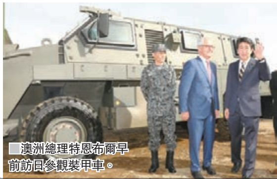
澳洲總理特恩布爾早前訪日參觀裝甲車。

澳洲總理特恩布爾昨日公佈新國防出口策略，包括一項總值38億澳元(約240億港元)的貸款計劃，以提升澳洲國防工業競爭力，爭取來自中東、印太地區和歐洲的訂單，冀在10年內躋身全球十大武器出口國，強調計劃有助創造職位。國際救濟組織世界宣明會澳洲分部主管科斯特洛批評澳洲政府一方面削減人道援助，