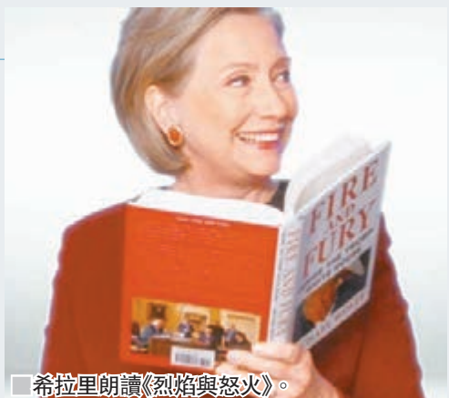
希拉里朗讀《烈焰與怒火》。