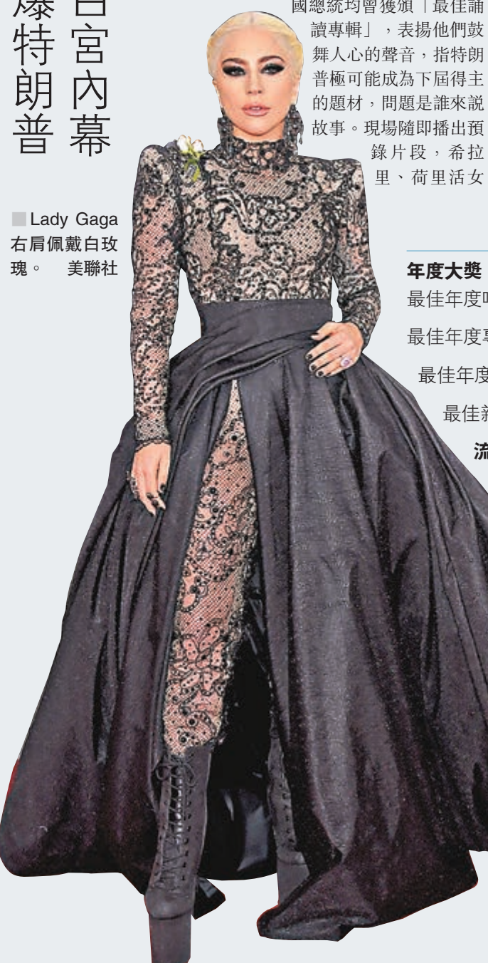
Lady Gaga 右肩佩戴白玫瑰。

星雪兒與一眾歌手輪流朗讀《烈焰與怒火》內容。希拉里說：「他(特朗普)多年來一直怕被下毒……麥當勞的食物都是預先做好，安全無虞。」