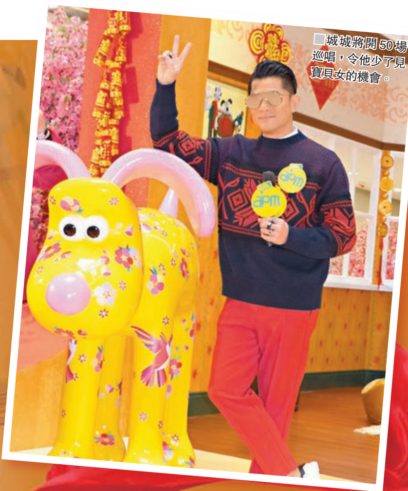
城城將開50場巡唱，令他少了見寶貝女的机会。