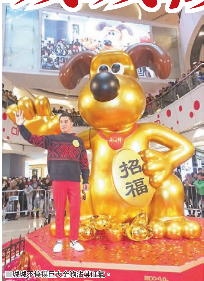
城城不停摸巨大金狗沾其旺氣。

香港文匯報訊(記者李思穎)郭富城(城城)昨日以紅色裝扮出席觀塘一商場的狗年迎春活動，吸引不少市民企滿商場圍觀。心情大靚的城城揮手打招呼，現場放上巨型招財狗，他不停摸金狗沾旺氣，並提早向大家拜年。婚後的城城多次表示現在家庭圓滿，可更專心工作，當大家祝福他追多個「狗」年B時，城城笑說：「承你貴言！」更認為「上天知道你做到爸爸的榜樣後，就會賜個B給你」。