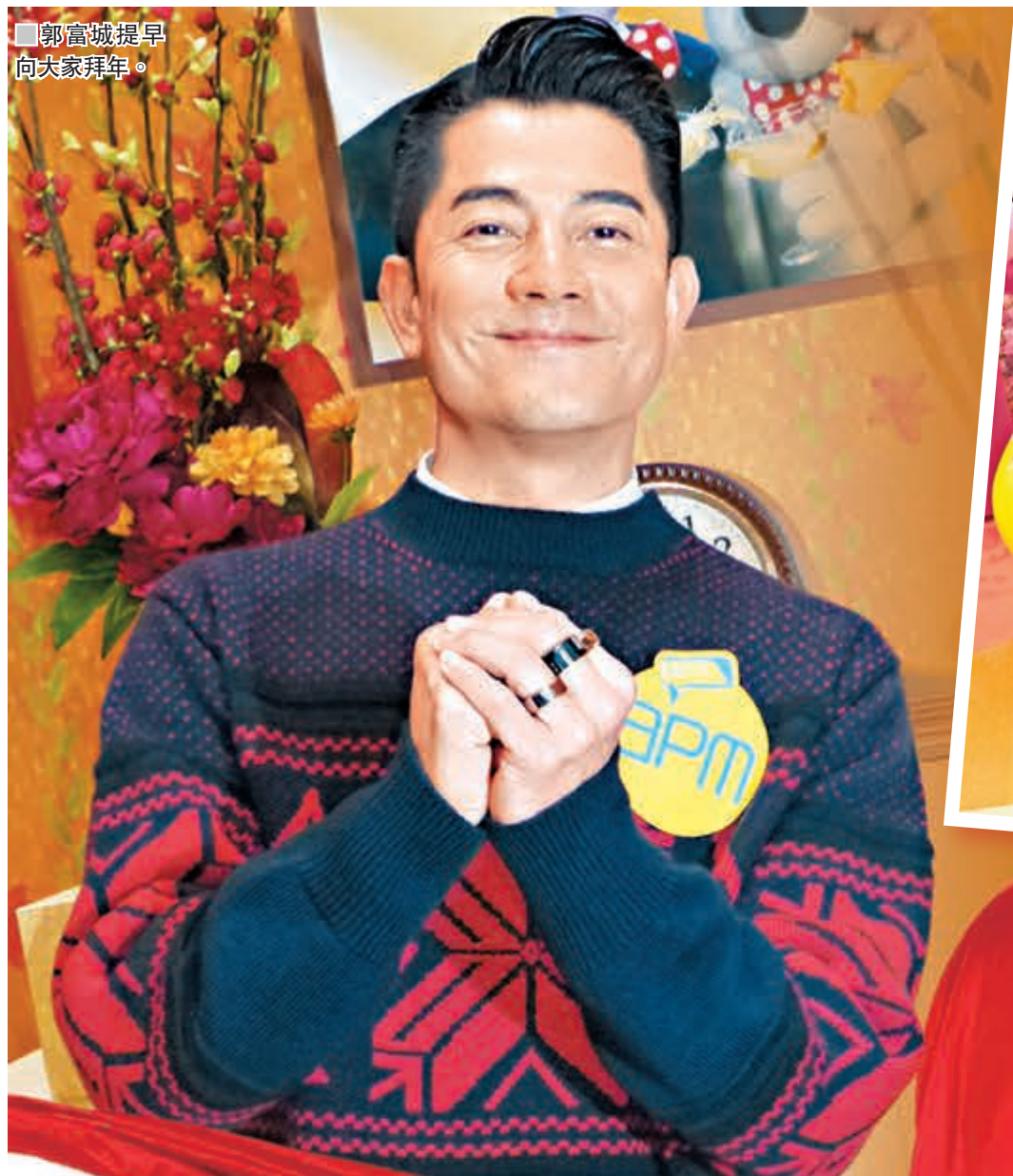
郭富城提早向大家拜年。