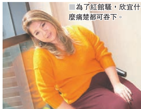
為了紅館騷，欣宜什麼痛楚都可吞下。

日前有傳媒拍到城城和太太到中環購物，問他現在是否多些陪太太去購物？「我是為屋企人去辦年貨，買給媽媽。當天不是買了18對鞋，只是買了9對而已。」隨即他又風騷開心地展示腳上的鞋子，更透露這便是當日太太陪買的，而且是狗年限量版。