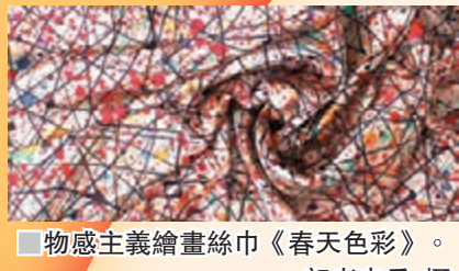
物感主義繪畫絲巾《春天色彩》。