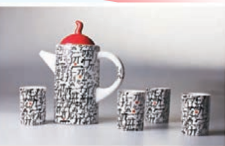
許燎源設計的瓷器作品。記者李兵攝