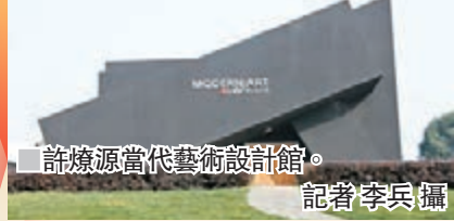
許燎源當代藝術設計館。記者李兵攝