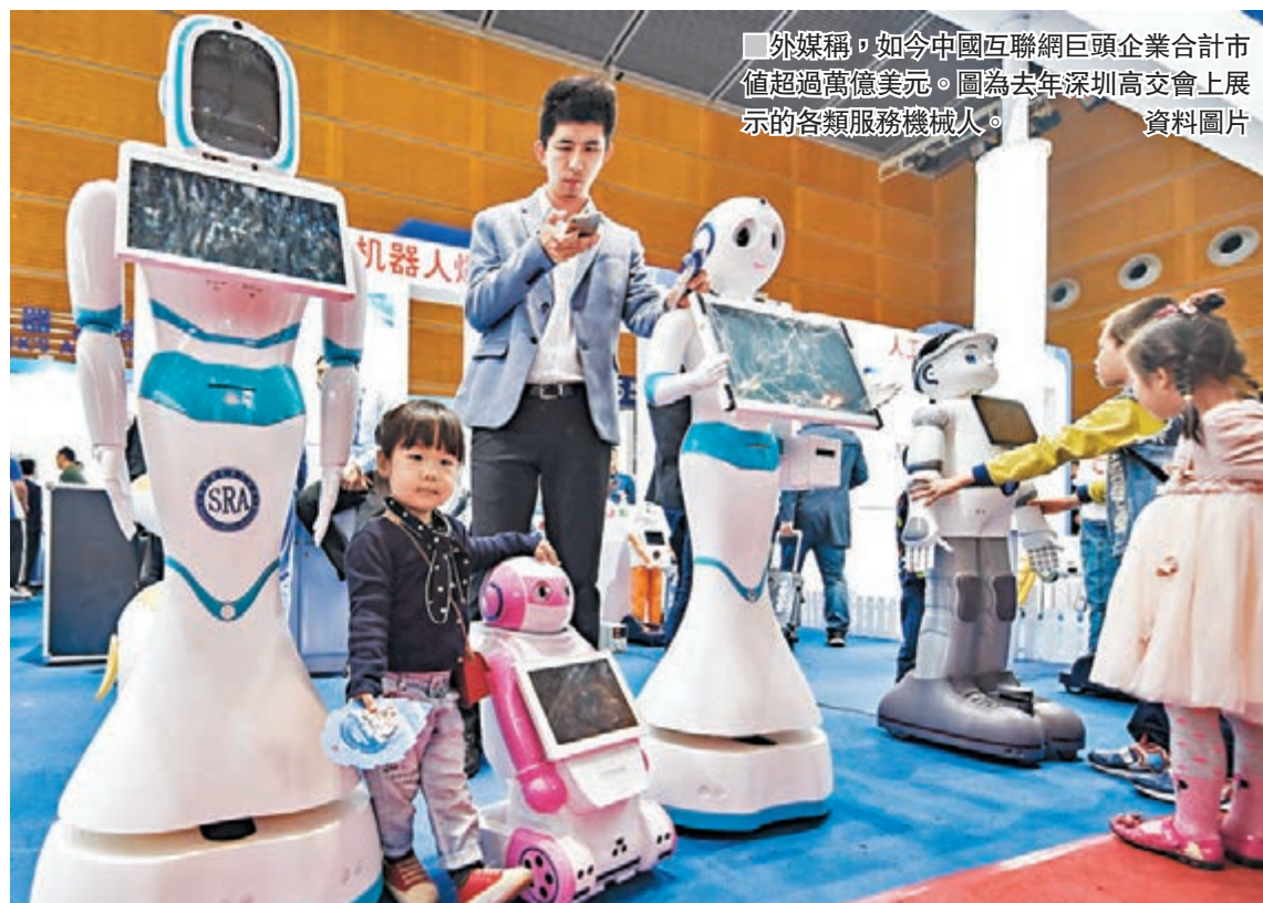
外媒稱，如今中國互聯網巨頭企業合計市值超過萬億美元。圖為去年深圳高交會上展示各類服務機械人。

報道還稱，進入大中華地區科技領域的資金仍在滾滾而來。普雷欽研究公司數據顯示，去年大中華地區風險投資（VC）的規模超過650億美元，較前一年增加35%，並且創下歷史新高，僅次於北美洲的770億美元。 據悉，中國將推動互聯網、大數據及人工智能與傳統經濟的整合，信息科技、機械人、節能汽車等領域備受關注。報道稱，此輪科技榮景已經蔓延至中國內陸城市，蘋果和高通等美國科技巨頭已在西南部的貴州省投入巨資。