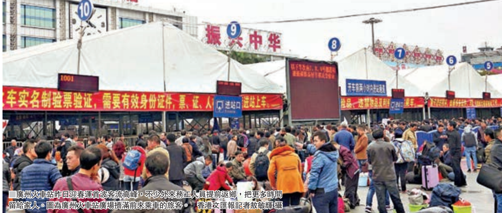
廣州火車站昨日迎春運首波客流高峰,不少外來務工人員提前返鄉,把更多時間留給家人。圖為廣州火車站廣場擠滿前來乘車的旅客。

香港文匯報訊(記者 敖敏輝 廣州報道)昨日是2018年春運啟動前最後一個周末,不少外來務工人員提前返鄉,珠三角主要車站迎來第一波客流高峰。返鄉旅客當中,以避開春運乘車高峰而提前返鄉的為主,亦有因工廠開工不足提前放假的工人。擠出更多時間陪家人,是多數旅客的選擇。為了應對客流小高峰,廣州火車站等集散車站已搭起旅客臨時候車大棚,春運義工亦提前上崗,疏導旅客。