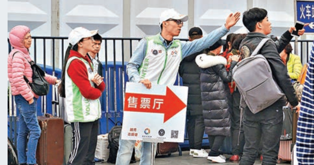
廣州火車站義工提前上崗疏導旅客。