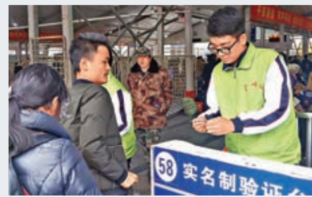
旅客通過春運實名制驗票程序進站。