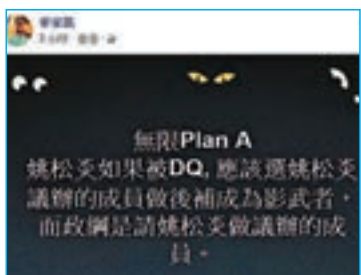
部分「自決派」與蟲炎死忠無限支持 Plan A，講得好聽就「倫理」、搵影武者，講白啲咪搵傀儡囉。