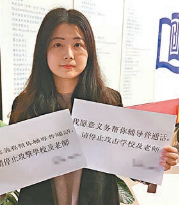
陳同學希望幫助有需要同學義補普通話。

對於部分同學的「佔領」及威嚇言行，陳同學則坦言不贊同，認為相關行為「太譁眾取寵」，強調「那不代表我們（浸大學生）」。她又說，不怕有人攻擊自己，重申「只是想幫同學」。