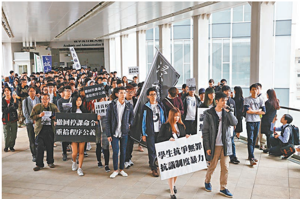
浸大學生會昨日在校內發起遊行，隊伍中卻出現數十計校外團體，更有大批播「獨」政客，以及多名立法會補選反對派參選人。