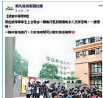
東九龍社區關注組在fb報道集會。