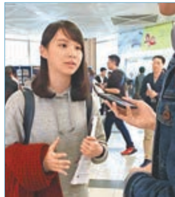
周庭現身浸大學生會組織的遊行。