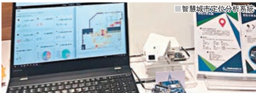
智慧城市定位分析系統