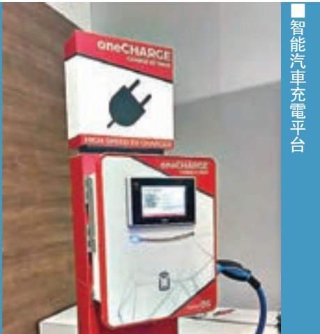
智能汽車充電平台

電動車充電器不足一直為人詬病，智能汽車充電平台將能提供充電車位預約服務，兼具收費功能。充電平台兼容各國充電標準，適用於市面大部分充電汽車型號，可支援並整合至現有的停車場管理系統。除了有助提升停車場服務水平，充電車位業主亦可出租閒置充電車位以賺取收入。由於此裝置可採用NB-IoT技術，覆蓋更為廣闊，可輕易將數據傳送至管理系統，無須於停車場另建網絡，成本大大減低，預計於今年第二季推出市場。