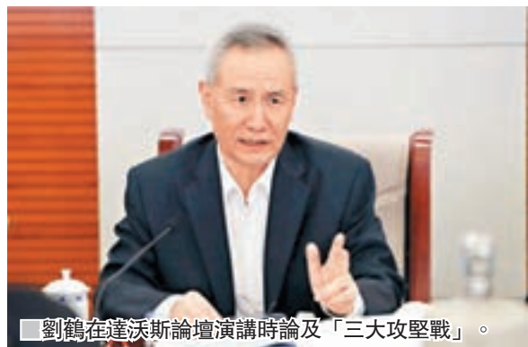
劉鶴在達沃斯論壇演講時論及「三大攻堅戰」。

香港文匯報訊 中央財經領導小組辦公室主任劉鶴周三在達沃斯論壇的演講,其中在論及「三大攻堅戰」時表示金融風險是在中國經濟面臨的各類風險中突出的問題,指出中國繼續打好防範化解重大風險攻堅戰。國泰君安昨解讀劉鶴的講話指,金融去槓桿的提法被穩定宏觀槓桿、增強金融服務實體能力的表述替代更具合理性,預計從政策面來看,金融體系仍然總體偏緊,債市難有大機會,但是在程度上更接近於日子難熬,而非休克療法。