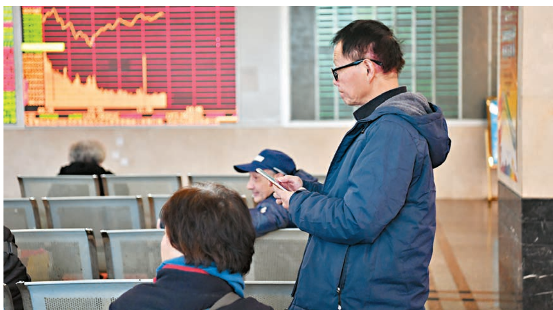
滬綜指今年以來走勢

樂視網連續第二日跌停,昨日收盤報12.42元,跌停板上封單848萬手,全日成交995萬元,較上一個交易日的3,351萬元銳減,該股當日再現大宗交易,成交100萬股。