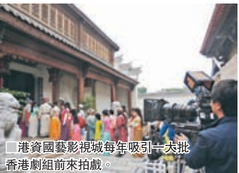
港資國藝影視城每年吸引一大批香港劇組前來拍戲。

冼國林說,目前廣東每年電影票房佔內地的七分之一,居內地首位;現時佛山正致力打造成世界級影視中心,但國藝影視城一期的配套已不足以支撐未來的發展。因此二期項目將打造更多更專業的攝影棚和影視精品酒店,升級影視配套;同時發展「影視+旅遊」,如在國藝影視城打造成夜景景點,結合傳統燈飾和現代VR技術打造成一個特色影視文化旅遊點。在啟動儀式上,來自內地及港澳10家進駐影視企業代表現場一次性簽約落地至少30個影視項目。