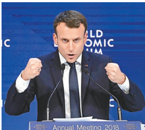
馬克龍揚言法國經濟改革後已「回歸」，再次成為歐洲核心。

特朗普當選美國總統前，不少分析員均預料他提出的保護主義政策，可能引發貿易戰及經濟衰退，但美國經濟過去一年維持穩健增長，股市屢創新高，稅制改革方案亦順利通過，降低企業經營成本，預料特朗普將在論壇上提到這些成果。他啟程前表示，期望藉今次行程能吸引商界投資美國。他前日在推特發文時，亦稱此行是要向世界宣示美國的強大，「我們經濟繁榮，只要有我在，這只會愈來愈好……我們的國家將再次勝利！」