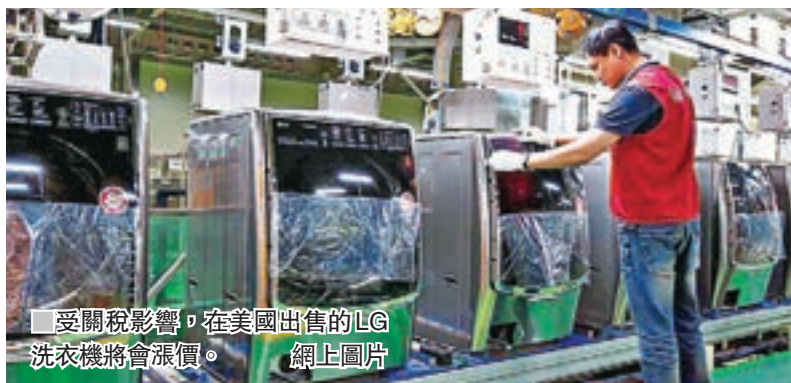
受關稅影響，在美國出售的LG洗衣機將會漲價。網上圖片

韓國LG電子美國分公司前日致函零售商，警告由於美國總統特朗普政府周一對進口洗衣機徵收關稅，在美國出售的LG洗衣機將會漲價，成為貿易夥伴對華府新關稅措施的首項實質回應行動。《華爾街日報》報道，部分洗衣機和乾衣機將加價約50美元(約391港元)。