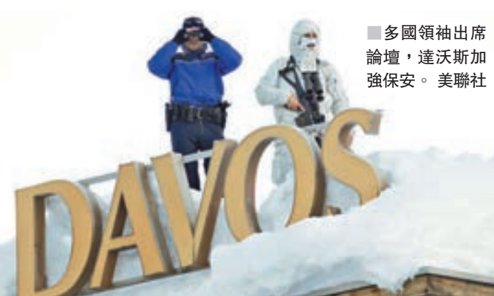
多國領袖出席論壇，達沃斯加強保安。