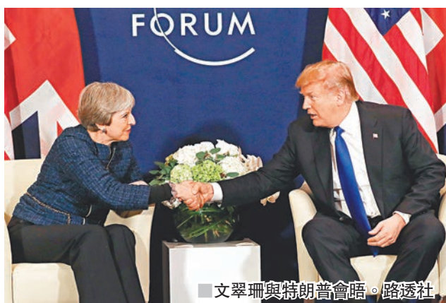
文翠珊與特朗普會晤。