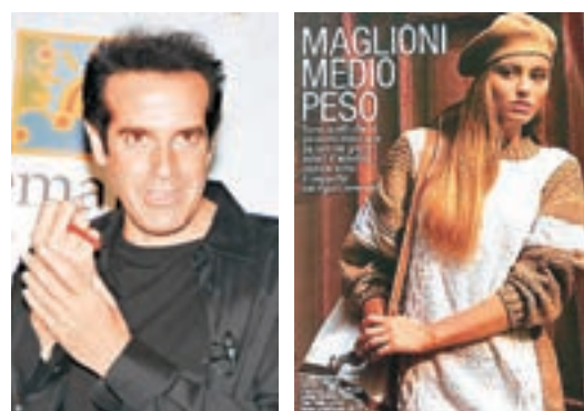
大衛高柏飛 模特兒劉易斯

美國魔術大師大衛高柏飛前日捲入性侵醜聞，被指在1980年代末迷姦一名17歲女模特兒。在報道曝光前數小時，大衛高柏飛在推特表示支持反性侵運動「#MeToo」，又聲稱曾面對不實的性侵指控，希望外界小心求證，不要妄下判斷。