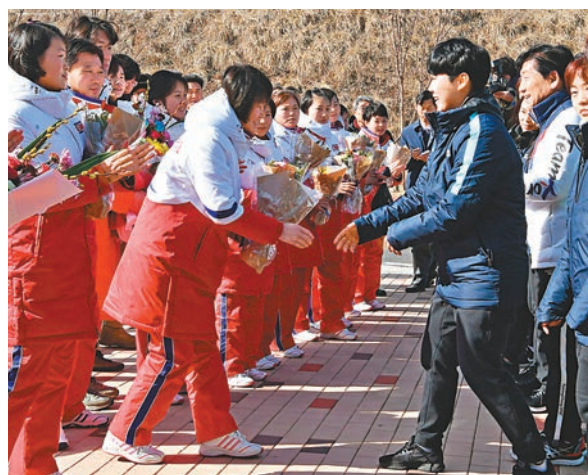
朝鮮女子冰球代表團(左)抵韓，到選手村與韓方隊員(右)會合。

朝鮮政府、政黨和團體前日在首都平壤舉行聯合會議，呼籲盡快改善朝韓關係，並進行廣泛交流與合作。另外，朝鮮女子冰球代表團昨日上午通過京畿道坡州的韓方出入境事務所(CIQ)抵韓，到選手村與韓方隊員會合，展開共同訓練；朝鮮冬奧先遣隊亦於同日入境韓國，考察賽場和表演場地等。