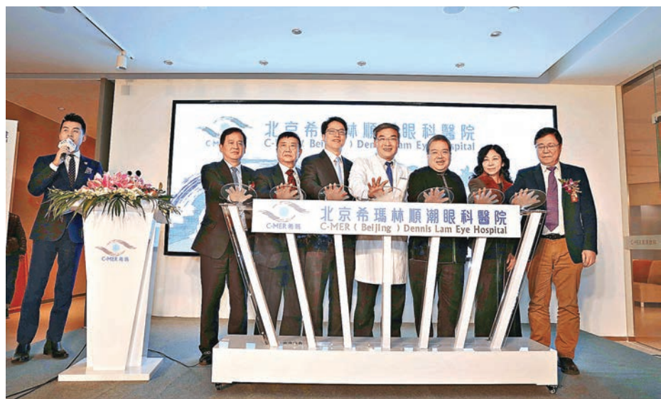
北京希瑪林順潮眼科醫院在京開業。

香港文匯報訊(記者 郭若溪)北京希瑪林順潮眼科醫院昨日在京開業,該醫院是香港希瑪眼科(3309)上市後,在內地佈局的第一家醫院。