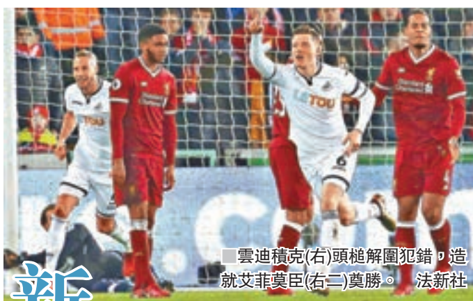
雲迪積克(右)頭槌解圍犯錯，造就艾菲莫臣(右二)奠勝。

男單8強，世界排名49的英國球手艾蒙特，以6:4、3:6、6:3、6:4意外地力克3號種子保加利亞名將迪米杜夫，4強會對陣施歷。克羅地亞人施歷昨晚面對頭號種子拿度，頭四盤3:6、6:3、6:7、6:2扳成2:2，決勝盤落後0:2時拿度因右大腿傷勢而無奈退賽。 ■香港文匯報記者 梁志達