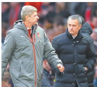
雲加塞翁失馬 寸王博一鋪

阿仙奴雖然留不住山齊士，然而收回2000萬英鎊現金另加米希達利恩的加盟，對領隊雲加來說或許是塞翁失馬，畢竟MK恩的踢法頗適合雲加的戰術，跟山神同齡來說，他踢進攻中場的職業生涯或可比踢前鋒的A山更長。