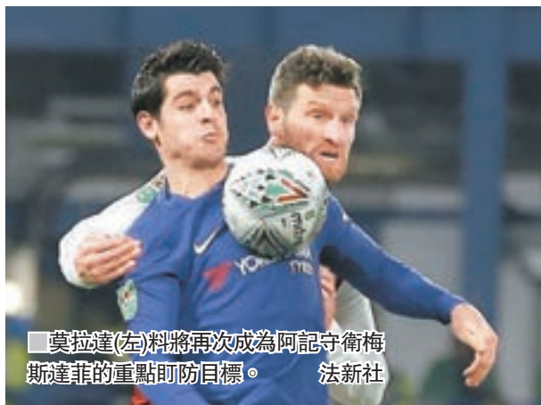
莫拉達(左)料將再次成為阿記守衛梅斯達菲的重點盯防目標。