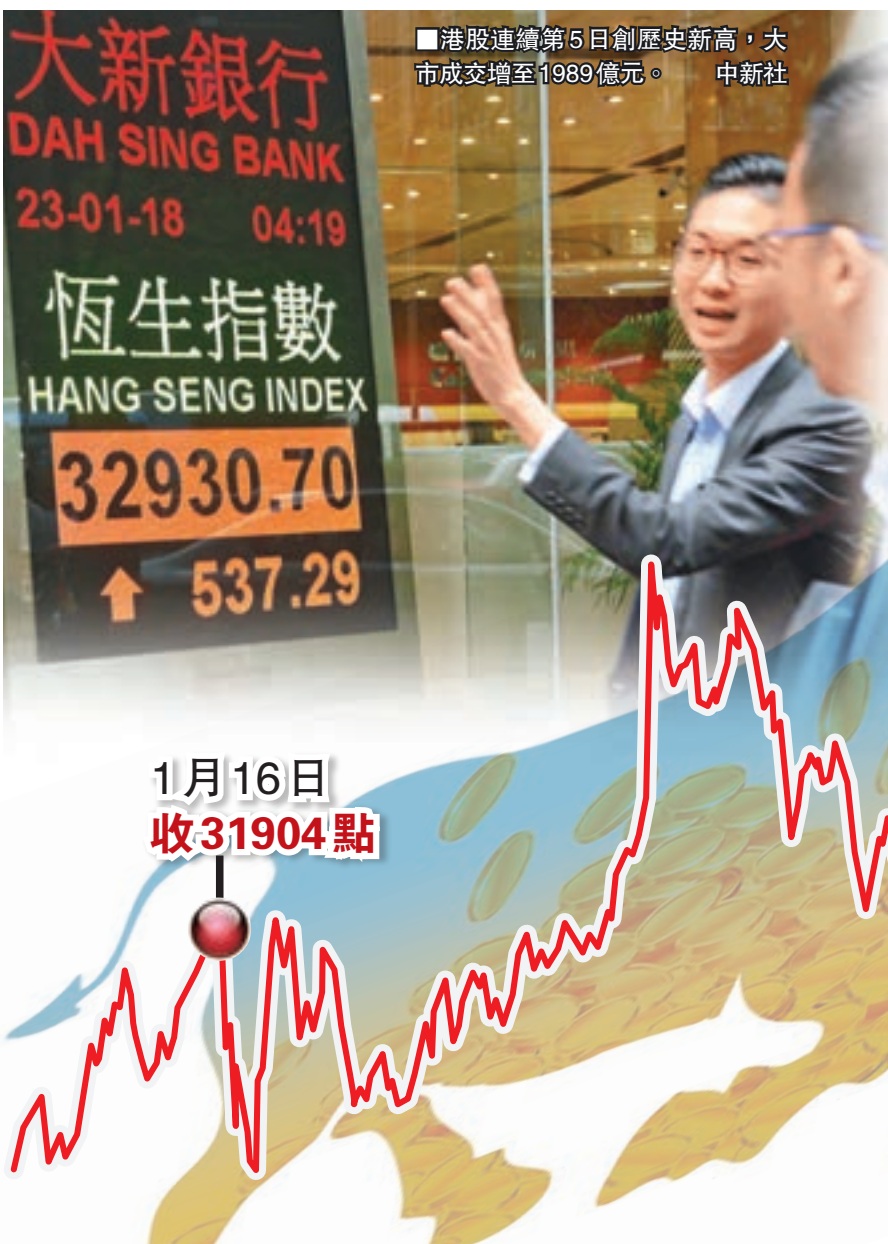
■港股連續第5日創歷史新高，大市成交增至1,989億元。