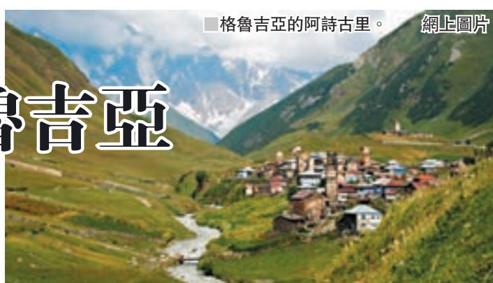
格魯吉亞的阿詩古里。網上圖片

翻開世界地圖,風景美麗和古蹟林立的國家,多不勝數,旅遊景點無處不在。但西方背囊客近年卻熱衷於一些鮮為人知的偏僻地區,如位於高加索山脈的格魯吉亞(Georgia)——一個等待開發的世外桃源。