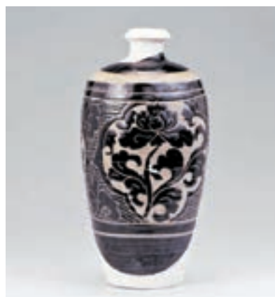
褐釉剔刻牡丹花瓷經瓶

香港文匯報訊(記者 宋偉 大連報導)絲綢之路上的西夏古國,公元1038年由黨項族建立,立國西陲,雄霸河朔。其鼎盛時期疆域「東盡黃河,西界玉門,南接蕭關,北控大漠」,前期與宋、遼鼎立,後期與南宋、金對峙,共經十主,歷時189年。它歷經近兩個世紀的風雲變幻,創造了輝煌璀璨的絲路文明。