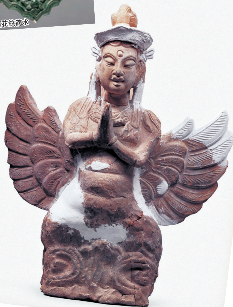
紅陶五角花冠迦陵頻伽

近日,由旅順博物館與寧夏回族自治区博物館聯合舉辦的《絲綢之路上的神秘王國——西夏文物精品展》在遼寧大連正式開展。該展集中了寧夏自建國以來考古發掘的西夏文物精品95件,通過西夏文字、工藝、佛教、建築四個單元全方位展示這個絲綢之路上的神秘王國。展期至3月20日。公元1227年,西夏被蒙古所滅,文物、典籍都遭到了毀滅性破壞,這個曾經盛極一時的絲路古國被逐漸湮沒在歷史的塵沙之中。20世紀以來,西夏古國的各類文獻、文物被大量發現,那些氣勢恢弘的佛教建築、精湛超群的石雕技藝、方正繁縟的西夏文字、美輪美奐的金屬製品,喚醒了人們對西夏文明的歷史記憶。