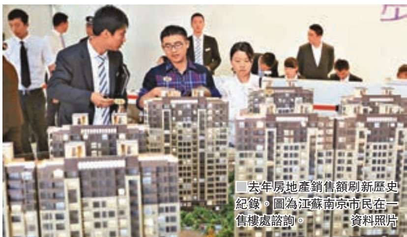
去年房地產銷售額刷新歷史紀錄。圖為江蘇南京市民在一售樓處諮詢。資料照片

另據國家統計局昨日公佈數據顯示,去年12月,北京、南京、無錫、杭州、合肥、福州、鄭州、深圳、成都等九座城市的新建商品住宅價格同比下降,降幅在0.2至3個百分點之間,意味著9座城市新商品房價格已經低於上年同期水平,顯示樓市調控