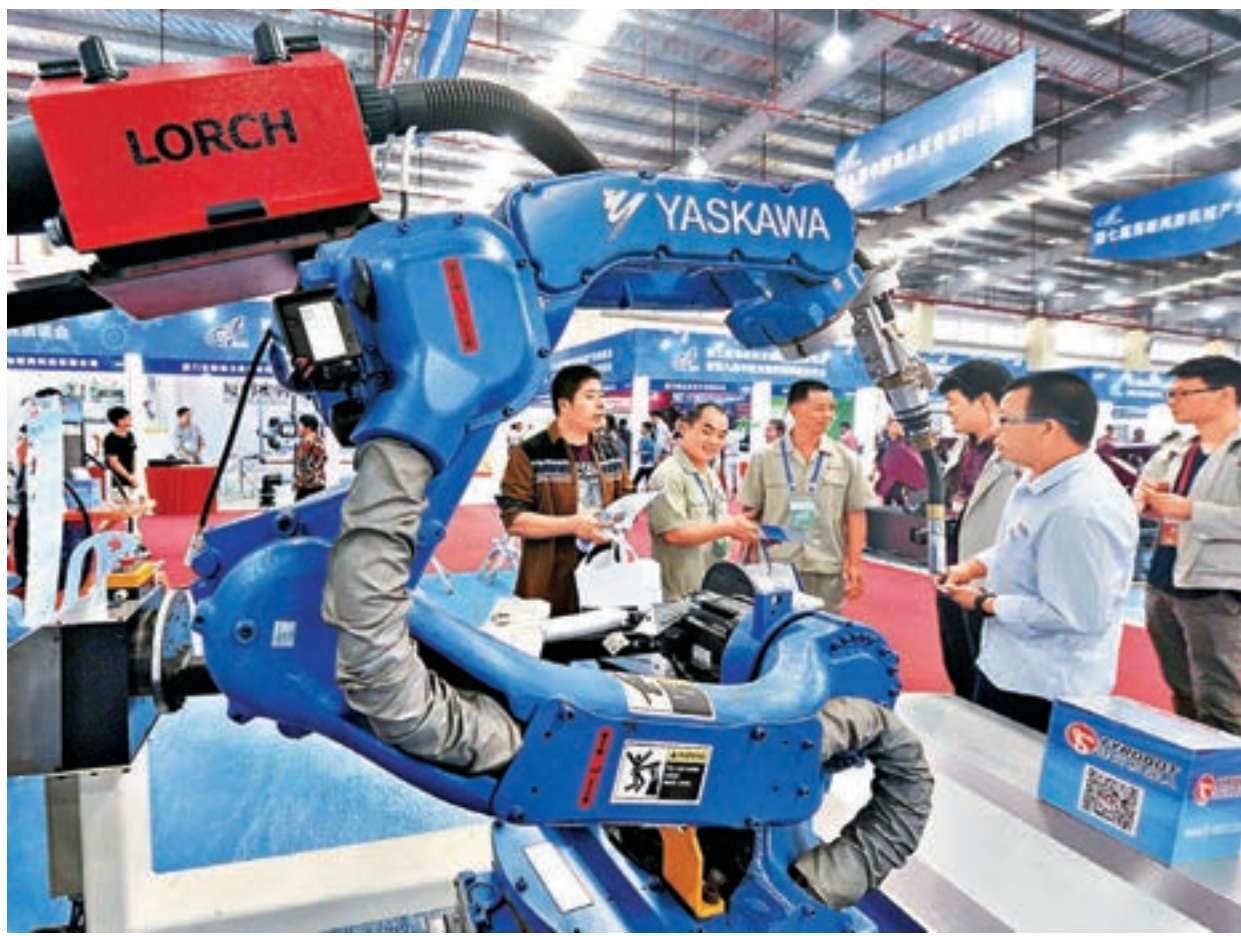
圖為福建龍岩一展會上,企業展出生產的智能機械設備。

今年中國經濟可否延續去年穩定增長態勢呢?國家發改委副秘書長范恒山昨日出席「2017財經中國年會暨第十五屆財經風雲榜」時表示,今年中國GDP增速可能微降,在6.5%-6.8%之間。尤其是,隨着科教興國、人才強國、創新驅動發展、鄉村振興、區域協調發展、可持續發展、軍民融合等重大戰略的強力實施,將帶來收益萬億級的巨大潛能的釋放,支持中國經濟向好。