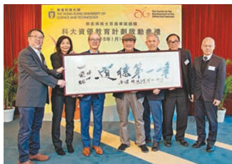
■科大向基金會代表致送橫匾,慶祝田家炳百歲壽辰。

撰文:香港家庭福利會 香港家庭福利會 註冊社工區家傑 查詢電話:2177 4567 網址: http://www.hkfw.org.hk