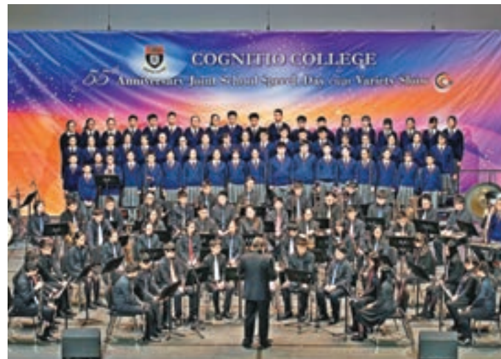
■九龍文理管樂團、合唱團演出。