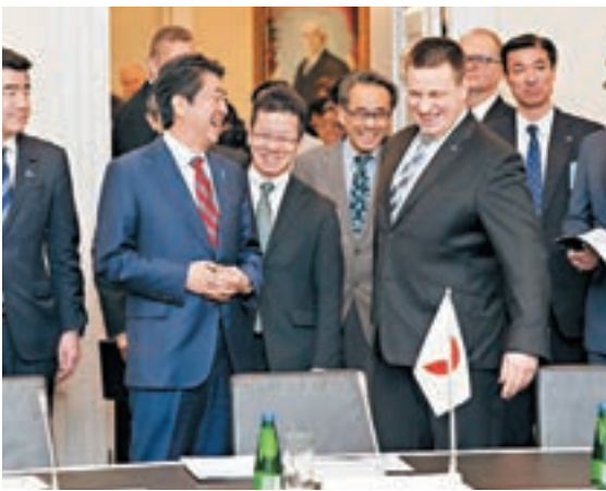
安倍到訪愛沙尼亞會晤總理拉塔斯(右前)。