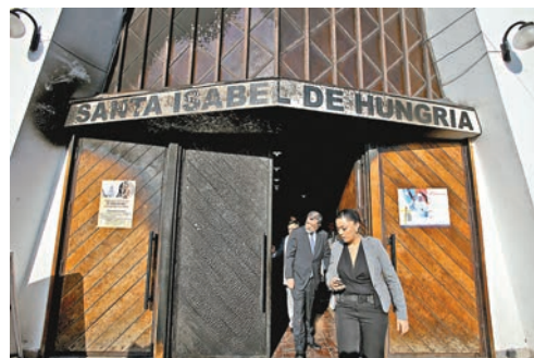
有遇襲教堂嚴重受損。