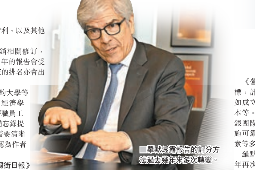
羅默透露報告的評分方法過去幾年來多次轉變。