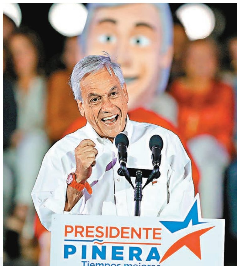
每當巴切萊特(左圖中)在任時，智利在《營商環境報告》的排名都會下跌，皮涅拉(右圖)上台後卻會回升。