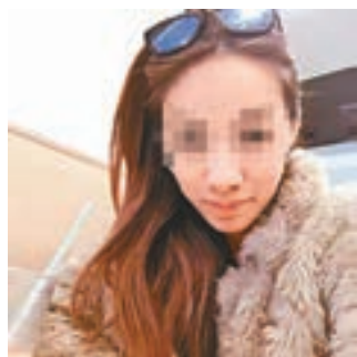
涉嫌虐兒被捕的高姓單親母親。

該副校長續稱,女童本身有家庭社工跟進,而學校社工與家庭社工一直有就女童個案保持密切溝通。女童性格樂觀,是一名「懂事小朋友」,過往未曾發現她身有傷痕,並正常參與學校課外活動。所幸今次事件女童安全獲救,希望她有適當照顧,並能盡快復課。 教育局回應指正跟進事件,會致力為有關幼稚園、學校及學生提供支援。又指教育局人員一直聯同校方跟進事件,兩所學校均有跟進兩姊妹斷續缺課的情況,除積極聯絡家長,查詢缺課原因外,亦聯絡社工跟進,並通報教育局跟進學生的缺課情況。