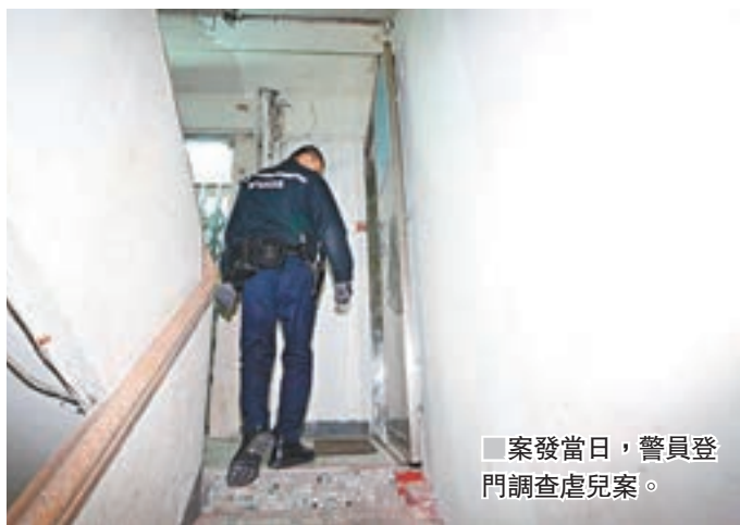
案發當日,警員登門調查虐兒案。