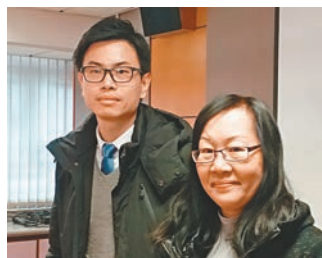
8歲女童就讀小學的曾副校長(左)及葉副校長(右)對事件感到難過。