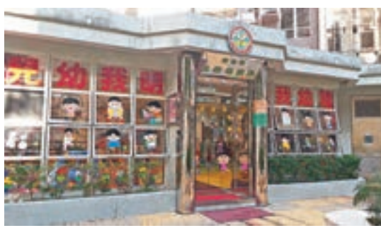
4歲男童就讀幼稚園K2,但開學至今經常缺課。