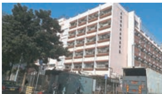
8歲女童就讀的油麻地東莞同鄉會方樹泉學校。