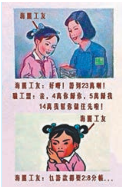
有網民改圖寸職工盟怕工人。