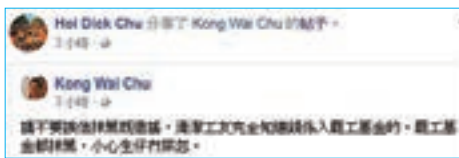
「本土」來抽水 勿忘「袋住先」

話說職工盟罷罷完工之後同傳媒講，佢哋為今次罷工籌得超過23.3萬，並已經向首批罷工嘅21個工友發放每人千八百蚊「津貼」，剩返嘅18萬就留返「日後其他工人抗爭」。咪住先，問過捐者同意未啊？