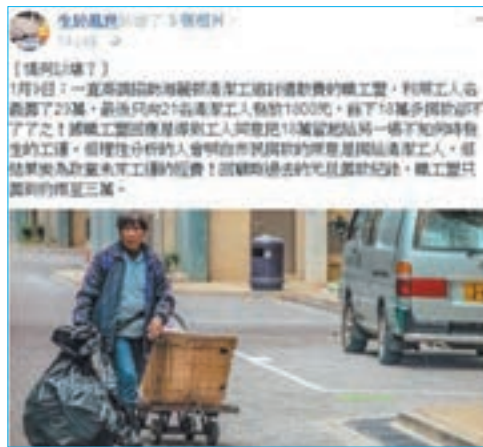
「生於亂世」唔妥職工盟，質疑他們「眾籌」係落格。