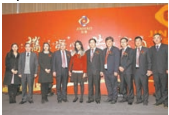
中國金灝宣佈正式成立。