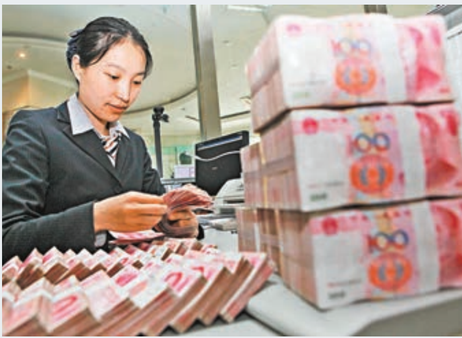
「逆周期因子」暫時退場，人民幣中間價昨天即脫離20個月新高。資料圖片