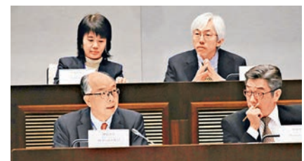
運輸局局長陳帆(前排左)認為,日後仍有時間及有信心覓得足夠土地。

建公私營房屋六比四。陳帆表示,長策訂下10年提供28萬個(公營房屋)單位的目標,但現時只覓得23.7萬個單位的土地,的確存在落差,但認為日後仍有時間及有信心覓得足夠土地。