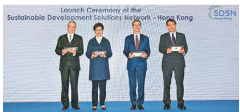
啟禮由行政長官林鄭月娥等主禮。

香港文匯報訊（記者高鈺）促進社會可持續發展，包括消除貧窮、實現平等和應對氣候變化等，都是近年全球關注點，中文大學和賽馬會早前獲聯合國可持續發展解決方案網絡（SDSN）確認，成立SDSN香港分會，跨界別推動可持續發展。分會昨日舉行啟禮，邀得行政長官林鄭月娥、中大校長段崇智、馬會副主席周永健等任主禮嘉賓。段崇智表示，大學推動可持續發展責無旁