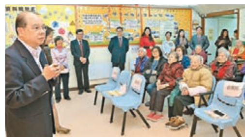
■ 張建宗表示,高津津貼額將較現行長津全額多約三分之一。

特首林鄭月娥在首份施政報告中提出251項新猷,並開列469項持續推行措施。政務司司長張建宗指出,多項預期在今年上半年出台的利民惠民措施,值得留意,包括經改善的「低收入在職家庭津貼」計劃及終身年金計劃等;而將法定待產假增至5天的建議,亦期望在今年盡早落實。 張建宗昨日發表網誌指出,這些大大小小措施,都是為了回應社會訴求,改善民生,推動經濟持續發展,加強整體競爭力,打造香港成