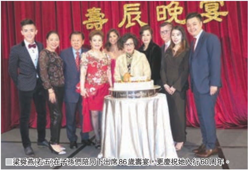
梁舜燕(右五)在子孫們陪同下出席86歲壽宴，更慶祝她入行60周年。

香港文匯報訊（記者 李慶全）「阮梁舜燕女士閃耀藝壇六十年暨壽辰晚宴」昨晚假太子一酒店舉行，86歲壽辰的梁舜燕(Lily)穿上旗袍靚靚，相當高貴。壽宴共筵開23席，到賀嘉賓有胡楓、羅蘭、胡定欣、宣萱、黃淑儀、杜平、劉丹、吳麗珠、王君馨、姚子玲、薛家燕等。