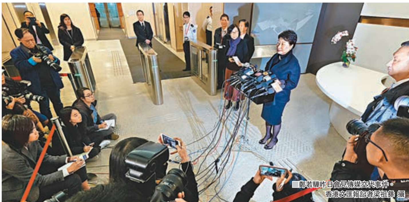
鄭若驊昨日會見傳媒交代事件。

鄭若驊發表聲明:「我昨(前)日(1月5日)收到屋宇署的通知,要求進入我的物業進行調查,就此,我已立即委託專業的