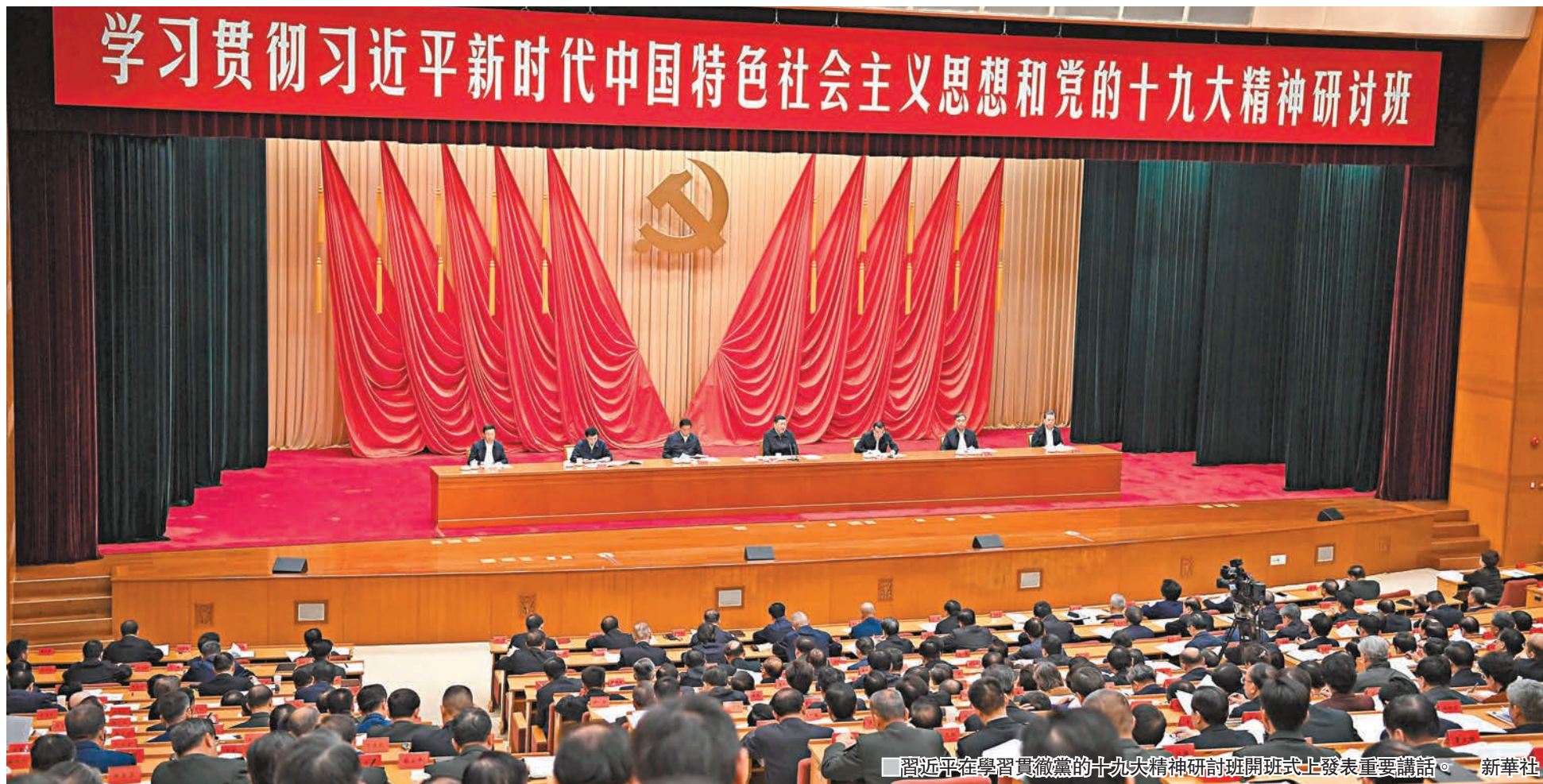
習近平在學習貫徹黨的十九大精神研討班開班式上發表重要講話。

不是從天上掉下來的，而是在改革開放40年的偉大實踐中得來的，是在中華人民共和國成立近70年的持續探索中得來的，是在我們黨領導人民進行偉大社會革命97年的實踐中得來的，是在近代以來中華民族由衰到盛170多年的歷史進程中得來的，是對中華文明5,000多年的傳承發展中得來的，是黨和人民歷經千辛萬苦、付出各種代價取得的寶貴成果。