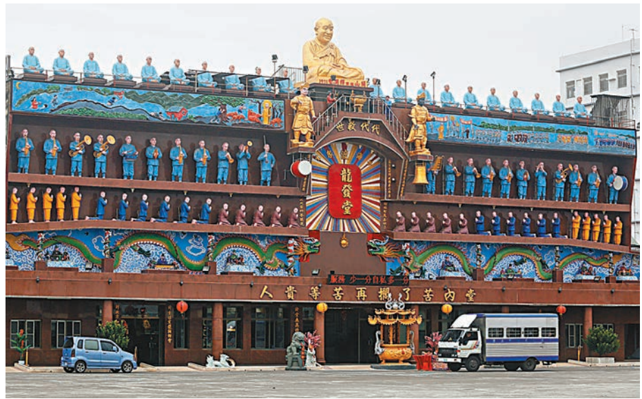
龍發堂自2010年至2017年以來，共有97名院友病死。中央社

香港文匯報訊 綜合中央社及台灣《中國時報》報道，台灣高雄一家有宗教背景的精神病患收容機構龍發堂，去年7月爆發結核病等疫情，當地衛生事務主管部門介入調查後發現，近8年該機構有97人死亡。高雄地檢署接獲情資顯示，龍發堂移送資料中疑有死因登載不實情形，將進一步調查，釐清確切死因。