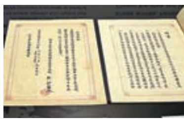
台灣地區「國史館」公開1,229萬頁史政檔案供免費下載。圖為該館珍藏的中文版日本降書。資料圖片

館方表示，今年起還將加速提供檔案線上服務，電子檔的上架頻率由原來的每月改為每月一次，充分落實「回歸法制，充分公開」原則，並不斷改善目錄及檢索系統功能，提供更迅速、優質的檔案服務。