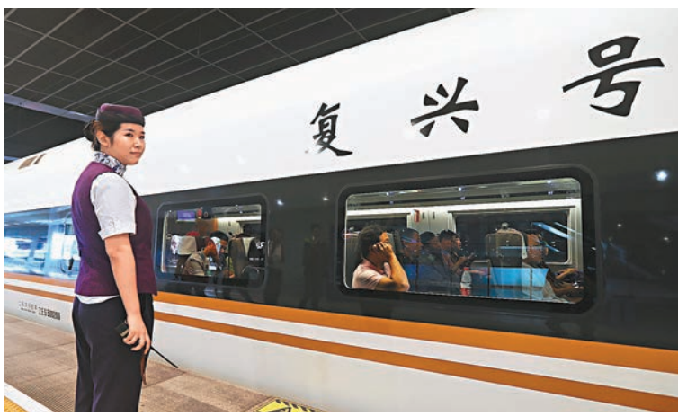
■受訪者對中國在科技領域參與全球治理的表現尤為認可。去年9月，「復興號」以350公里時速正式運營，標誌中國成為世界高鐵商業運營速度最高的國家。

香港文匯報訊(記者 張帥 北京報道)中國外文局昨日在京發佈的第5次中國國家形象全球調查(2016—2017)顯示，中國國家整體形象得6.22分，延續了近年來小幅增長的勢頭，中國整體形象好感度穩中有升。此外，中國對全球治理的貢獻和國內治理的表現得分分別為6.5和6.2分，顯示出中國的國際貢獻得到更多認可。