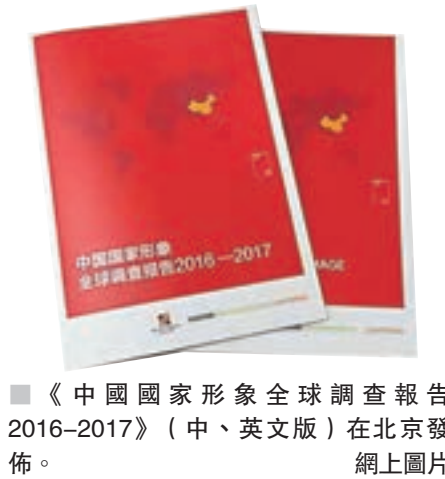
■《中國國家形象全球調查報告2016—2017》(中、英文版)在北京發佈。