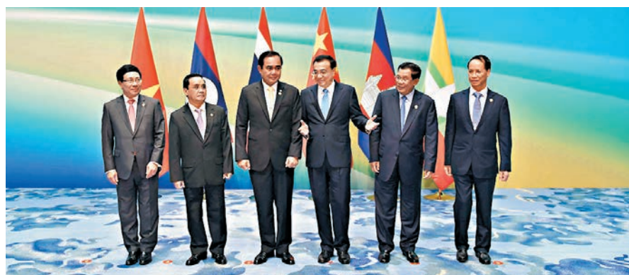
■ 李克強(右三)去年在海南三亞國際會議中心主持瀾滄江—湄公河合作首次領導人會議。圖為李克強與參會各領導人合影。

香港文匯報訊(記者 葛沖 北京報道) 昨日透露，屆時，會議將發表《瀾湄合作五年行動計劃》，六國將在水資源、產能、農業、培訓、衛生、醫療等領域宣佈一批重要的合作倡議和具體舉措。此外，中柬將加快發展戰略對接，簽署有關科技、農業、林業、基礎設施等方面的合作文件。