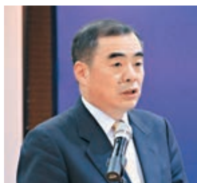
■ 孔鉉佑 資料圖片