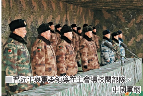
■ 習近平與軍委領導在主會場校閱部隊。