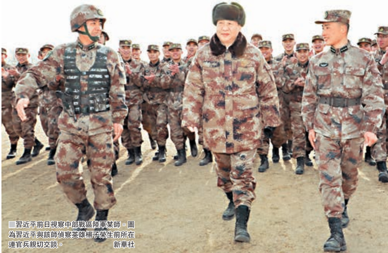
■ 習近平前日視察中部戰區陸軍某師。圖為習近平與該師偵察英雄楊子榮生前所在連官兵親切交談。

隨後，習近平聽取了該師工作情況匯報，並發表重要講話。他強調，要強化練兵備戰，全部心思向打仗聚焦，各項工作向打仗用勁，加強數字化部隊作戰研究，創新作戰概念和戰法，大抓實戰化軍事訓練，不斷提高訓練水平和打贏能力。要強化體系建設，統籌加強各種力量、各個系統、各類要素建設，加強信息系統和作戰數據建設，確保成體系形成作戰能力，有機融入全軍聯合作戰體系。要強化改革創新，優化編成結構，加強科技運用，增強官兵科技素養，積極推進創新型人民軍隊實踐探索。要強化政治保證，抓好黨的十九大精神學習貫徹，貫徹古田全軍政治工作會議精神，按照新時代黨的建設總要求加強各級黨組織建設，開展「傳承紅色基因、擔當強軍重任」主題教育，確保部隊堅決聽從黨中央和中央軍委指揮。各級要高度重視數字化部隊人才隊伍建設，培養一批高素質新型軍事人才。要滿腔熱忱為官兵辦實事、解難事，堅決糾治基層官兵身邊的「微腐敗」和不正之風，把廣大官兵積極性、主動性、創造性充分調動起來，共同把部隊建設推向前進。