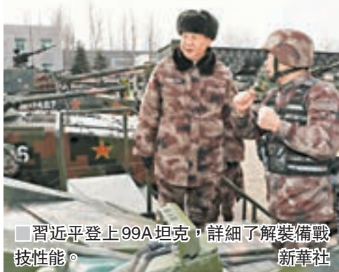
■ 習近平登上99A坦克，詳細了解裝備戰技性能。