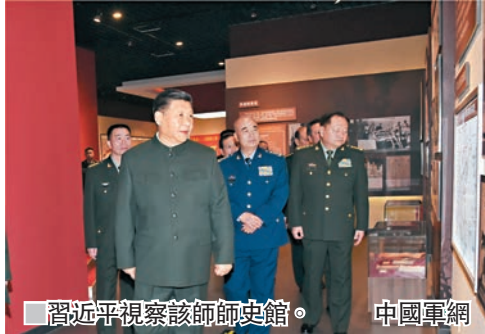
■ 習近平視察該師師史館。 中國軍網