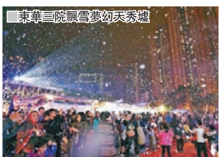
東華三院飄雪夢幻天秀墟