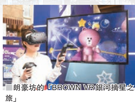
朗豪坊的「BROWN VR銀河摘星之旅」