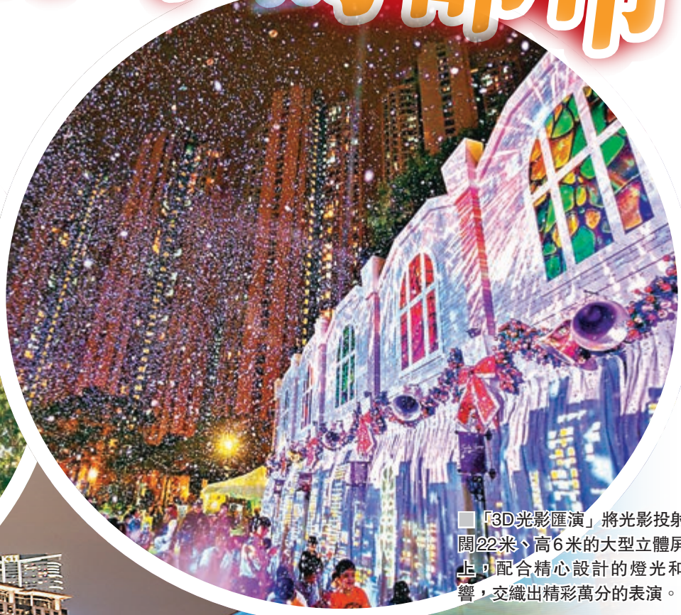
「3D光影匯演」將光影投射在闊22米、高6米的大型立體屏幕上，配合精心設計的燈光和音響，交織出精彩萬分的表演。