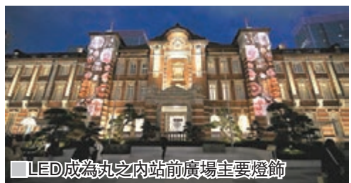
LED成為丸之內站前廣場主要燈飾

而東京汐留Caretta以迪士尼電影《美女與野獸》為意象推出浪漫彩燈，共使用約25萬顆LED燈泡，充滿浪漫氣氛，讓遊客感受童話故事氣氛。