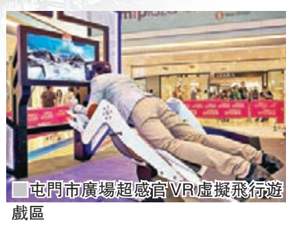
屯門市廣場超感官VR虛擬飛行遊戲區

在商場的一些聖誕佈置中，都融入了VR及AR的遊戲裝置，例如，在朗豪坊的Line Friends Christmas Planet裡，星光橋下設有BROWN VR銀河摘星之旅，參加者會跟BROWN搭乘星空小船，在銀河上展開摘星之旅，限時內收集到指定分數的星星。而希爾頓中心與好運中心早上上演「一擊即中」雪球大激鬥，在雪戰過程中，Kinect感應系統會捕捉你的肢體動作，在限時內擊中螢幕上的指定目標，即可搶分勝出。還有，在屯門市廣場內特設超感官VR虛擬飛行遊戲區，讓大家親身體驗超級英雄飛行之超能力。