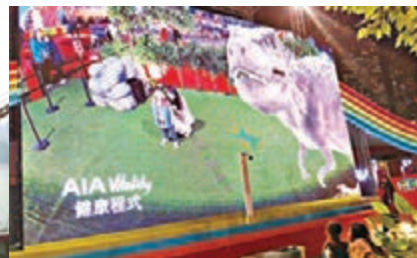
AIA Real Life Zone，在畫面會出現各種動物，猶如置身真實環境中。