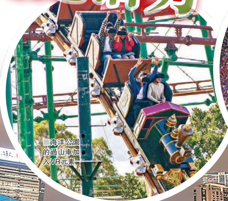
海洋公園的過山車加入VR元素