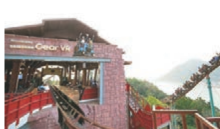
全港首個虛擬實境VR過山車

而且，今年的友邦歐陸嘉年華亦首次推出虛擬實境遊戲設備Virtuix Omni，讓玩家享受超逼真遊戲體驗，360度全方位自由步行、跑跳及坐下，完美沉浸在遊戲之中。而AIA Real Life Real Zone今年注入人工智能元素，帶來無可比擬的全新體驗，將真實世界及虛擬世界結合，讓參加者穿梭於非洲野生動物園和嚴寒極地，體驗更有趣的互動遊戲。