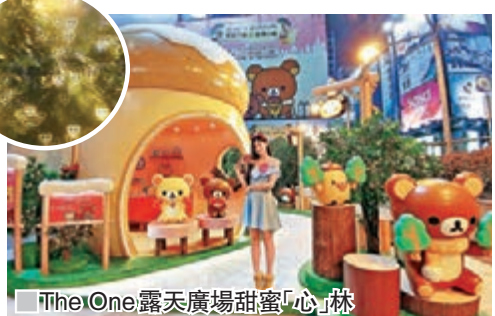
The One露天廣場甜蜜「心」林