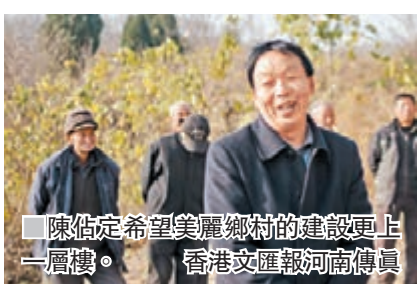
陳佔定希望美麗鄉村的建設更上一層樓。