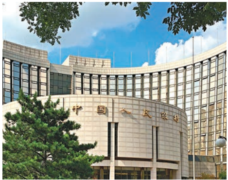
人民銀行昨天宣佈設立臨時準備金安排，紓緩春節期間流動性緊張。