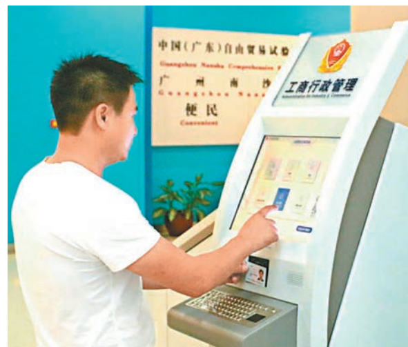
近五年來，中國營商環境的世界排名提高了18位。圖為商事改革便利了企業和個人登記註冊。

香港文匯報訊 據昨日在北京召開的中國全國工商和市場監管工作會議消息，中國商事登記制度改革縱深拓展，商事制度發生根本性變革。商事登記制度改革改善了營商環境，提高了中國國際競爭力及影響力。從2013到2017年度，中國營商環境的世界排名提高了18位，其中開辦企業便利度上升了65位。