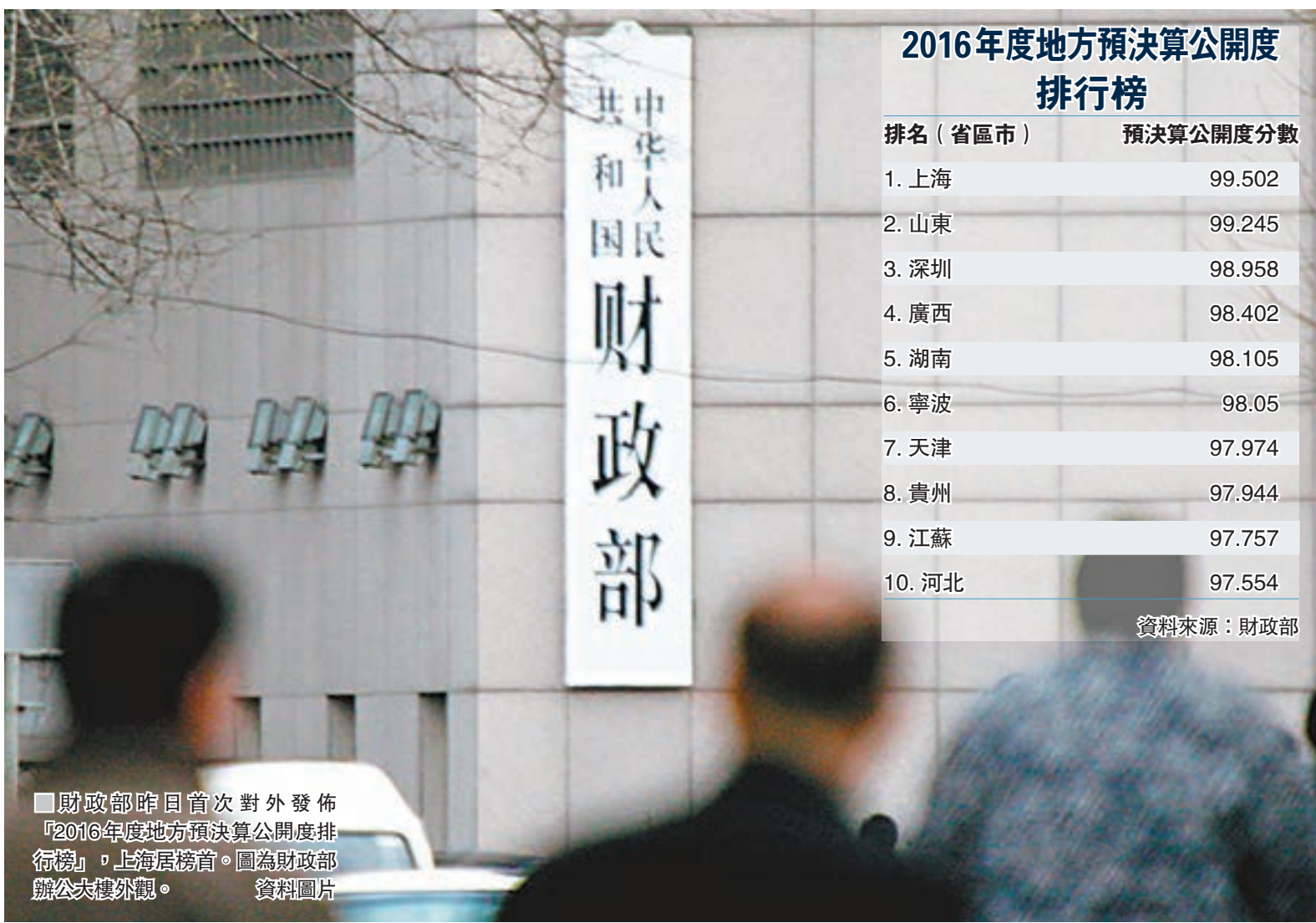
財政部昨日首次對外發佈「2016年度地方預決算公開度排行榜」，上海居榜首。圖為財政部辦公大樓外觀。

該負責人表示，目前，地方預決算公開工作仍然存在一些問題。下一步財政部將以建立全面規範透明、標準科學、約束有力的預算制度為目標，以預決算公開情況專項檢查為依託，堅持問題導向，重點關注決算信息真實性，狠抓督促整改，全面推進地方預決算公開工作再上新台階。