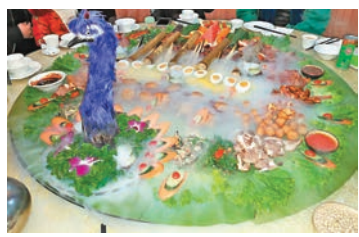
■十多樣傣族特色菜，真像孔雀開屏一樣。

這一晚是在大理的最後一晚，朋友帶去吃傣宴。常年在香港，幾乎沒有沒吃過的，傣族菜倒是頭一回。進了包房，着傣裙的服務小姐先在大擺盤上鋪滿鮮芭蕉葉，用清水抹淨，然後依次擺上三種米飯，第一層是紫糯雜米，第二層是薑黃飯，第三層是甜菠蘿飯，講明，用的是本地最好的貢米。像擺花一樣，擺放了香茅排骨、檸檬雞、烤肉、燻肉、薯丸、竹筍、十多樣傣族特色菜，真像孔雀開屏一樣。最欣賞的是竹筒飯，把糯米放進新鮮竹筒，燒烤而熟，鮮竹汁浸進軟綿的米飯，說不出來的鮮美。席間配的是傣族釀米酒，直喝到人人醉醺醺。啊，美哉，大理。