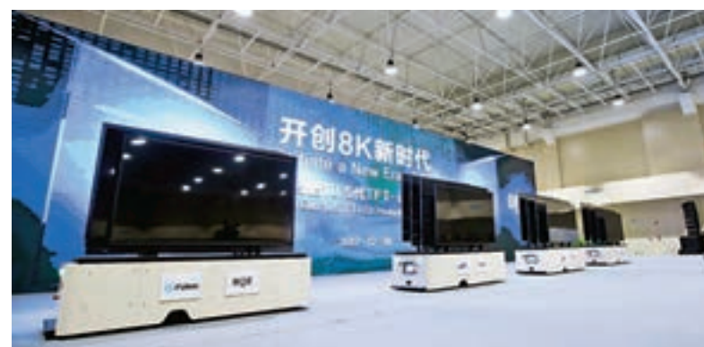
京東方10.5代線主要生產65吋以上超高清液晶顯示屏

服務方面，圍繞京東方上下游重點企業，新站高新區在行政審批、資金支持、要素保障、公共配套方面都開闢了綠色通道，實行各級領導調度制度，定期調度。打造高品質人才公寓，先後建設藍領公寓、平板顯示公租房、東方家園等項目並專門拿出4棟樓，約1208套宿舍打造成為高端公寓，並將其中的604套進行精裝修，配置傢俱桌椅、空調、電冰箱等，充分滿足企業高端人才入住需求，讓企業員工在合肥既能樂業，更能安居。