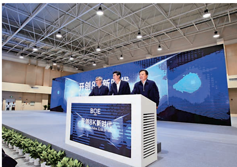
京東方10.5代線量產儀式現場

全國最重要的新型顯示產業基地和國家集成電路產業重點佈局城市。目前，合肥液晶顯示屏產量和配套能力均位居全國前列，集成電路企業超百家、從業人員超萬人，芯、屏產業是合肥轉型升級、創新發展的成功典範。據悉，未來合肥還將繼續推動集成電路高端研發、核心製造、關鍵材料和裝備等領域的集聚發展，打造具有全球影響力的「中國IC之都」！