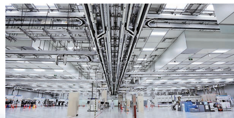
合肥晶集成集成電路生產線天車系統