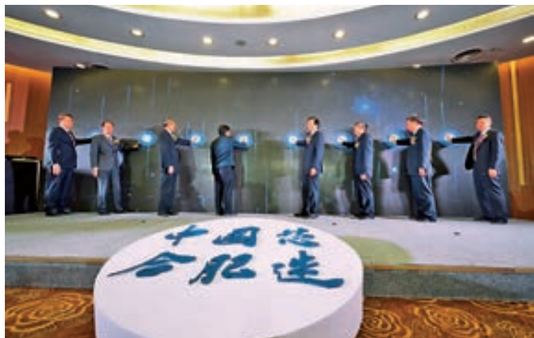
合肥新站高新區晶集成集成電路公司量產儀式

在玻璃基板方面，合肥新站高新區新型平板顯示產業基地內彩虹、康寧雙玻璃基板工廠布局的模式全國獨樹一幟；智能裝備方面，欣奕華、通彩、商巨、凱世通等國內市場佔有率遙遙領先；OLED蒸鍍、離子注入機產業化國內首創；光學材料方面，樂凱、三利譜、翰博、泰沃達在生產規模及技術先進性上均屬於國內領先地位；靶材領域，先導、江豐、拓吉泰等一批實力雄厚的企業紛至沓來；終端應用方面，惠科、京東方視訊、長虹等整機項目規劃年產能近5000萬台（套）。基地的產業整體規模、創新能力、本地化配套水平均在國內居於領先水平。截至目前，合肥新站高新區新型顯示產業基地從業企業超70家，累計投資項目超過100個，已完成投資超1300億元（人民幣，下同）。