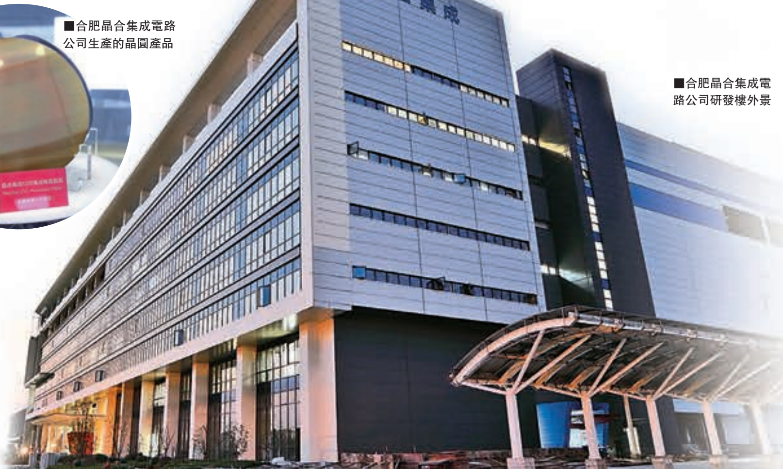
合肥晶集成集成電路公司研發樓外景