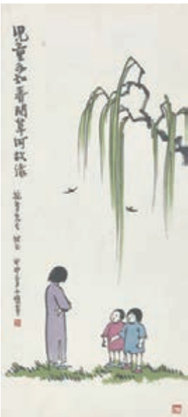
■《兒童不知春》 豐子愷