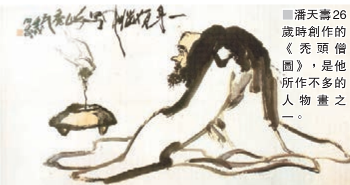
■潘天壽26歲時創作的《禿頭僧圖》，是他所作不多的人物畫之一。

大的一幅。畫面上，蒼鷹勁松，山高水長，潘天壽用雄渾霸悍的筆墨，古雅而輝煌的格調，熱烈祝賀祖國生日。畫上題詩為《卿雲歌》：「卿雲爛兮，糾縵縵兮。日月光華，旦復旦兮。1964年十五周年國慶，為作卿雲歌辭意頌之。」