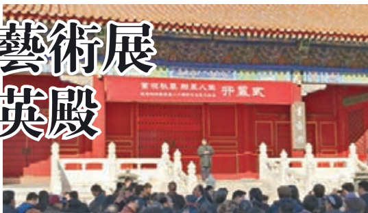
■「紫垣秋草 翰墨人生——紀念劉炳森誕辰80周年作品暨文獻展」在故宮武英殿開幕。

故宮博物院武英殿日前迎來新展覽——「紫垣秋草 翰墨人生——紀念劉炳森誕辰80周年作品暨文獻展」。在開幕式上，劉炳森的夫人將《隸書「古詩十九首選二」》《隸書蘇東坡詞「水調歌頭」》等劉炳森書法珍品無償捐贈給了故宮。據悉，劉炳森(1937—2005)是故宮著名書畫家，電腦字庫中的「華文隸書」的創作者。 據介紹，劉炳森1962年秋入故宮博物院工作。他早期從事古代書法繪畫一級藏品的臨摹複製、修復和研究，曾複製長沙馬王堆西漢帛畫、山東金雀山帛畫、宋人冊頁《巴山下峽圖》《山腰樓觀圖》等，同時創作山水畫《建明秋色圖》《龍潭秋瀑圖》等。 中年以後，劉炳森專注於書法創作與研究，成就主要在於隸書和楷書。他的隸書創作，從上世紀70年代就開始產生社會影響力，先後創作《國際歌》、三大紀律八項