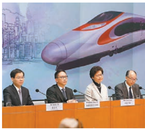
林鄭月娥(右二)指出，全國人大常委會為「一地兩檢」提供堅實的法律基礎，亦保障香港利益。

林鄭月娥昨日就全國人大常委會批准「一地兩檢」的合作安排舉行記者會，律政司司長袁國強、運輸及房屋局局長陳帆和署理保安局局長區志