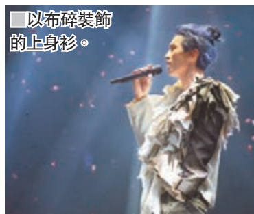
以布碎裝飾的上身衫。

由於大會特別製作演唱會的T-Shirt，他所穿着的Speechless黑色T-Shirt是將三件大會T-Shirt拼裝成類似蝙蝠袖的衫，大家都可使用自己的小小創意，發揮想像力，設計出與眾不同的服裝。