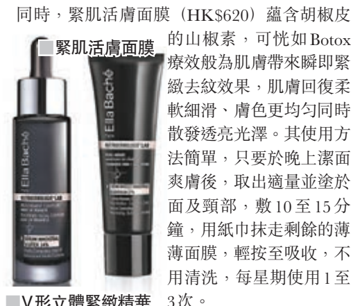
同時，緊肌活膚面膜（HK$620）蘊含胡椒皮的山椒素，可恍如Botox療效般為肌膚帶來即時緊緻去紋效果，肌膚回復柔軟細滑、膚色更均勻同時散發透亮光澤。其使用方法簡單，只要於晚上潔面爽膚後，取出適量並塗於面及頸部，敷10至15分鐘，用紙巾抹走剩餘的薄薄面膜，輕按至吸收，不用清洗，每星期使用1至3次。

例如，V形立體緊緻精華（HK$820），主要成分為紅藻類—紫羅蘭糖、地中海馬尾藻、燕麥糖、矽醇及羧基氨基酸、橄欖提取的山植酸等，其配方有助肌膚激活新生，極致緊膚拉提、重塑V形面部線條、豐盈面部輪廓及深層修護重組細胞，全面打造細緻小臉。大家只要早上輕拍及晚上於潔面爽膚後，取出適量並塗於面、頸部及胸前，以輕輕按摩面部肌膚至吸收，請連續使用最少45天。