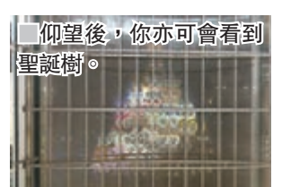
仰望後，你亦可會看到聖誕樹。

這兒共有36棵由紙包飲品盒再生的聖誕樹，在Courtyard中庭孕育成長，等待你來森林穿梭感受。其排列有序、錯落有致的叢林佈局不只創造眼前美好，大家更可從PMQ兩棟大樓俯瞰發現當中巧思，一棵棵小樹原來在地面構成了巨型聖誕樹的動人輪廓，不起眼的飲品盒通過「設計」成就出震撼人心的視覺藝術。