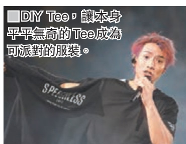
DIY Tee，讓本身平平無奇的Tee成為可派對的服裝。

由頭到腳都是一套紅色的西裝，亦使用了一些即時染色的髮泥，使頭髮即時變了紅色，讓整套服裝更突出。其實，現時都很流行Tone on Tone配搭，上身衫、下身褲，甚至頭髮，採用同一個Colour Tone，所以在派對中都可以嘗試採取這個配襯方法。