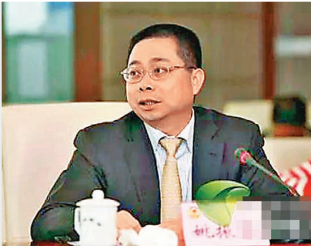
姚振華擬以10至15年時間，打造一個具備強大競爭力和國際影響力的汽車集團。資料圖片

香港文匯報訊 在萬科的控股權爭奪戰中被稱為「野蠻人」的寶能集團董事長姚振華，近期在汽車產業上逐漸實現「華麗轉身」。據騰訊報道，姚振華昨日在寶能新能源汽車產業園正式動工的活動上透露，其目標是用10至15年的時間，打造一個具備強大競爭力和國際影響力的汽車集團。該汽車產業園的總投資達300億元（人民幣，下同），首期規劃產能50萬輛新能源汽車及相關配套項目，整車和零部件製造產值將超過1,000億元。