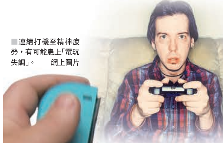
■ 連續打機至精神疲勞，有可能患上「電玩失調」。網上圖片

許多人手機不離手，尤其喜歡玩網上電子遊戲，但也有不少人因此不能自拔導致沉迷。世界衛生組織(WHO)將於明年發表的最新第11版國際疾病分類編碼(ICD)中，將「電玩失調」(Gaming disorder)納入危害精神健康的疾病之一，是首次將電玩成癮行為正式列為精神疾病。若玩家連續打機12小時，便可能患上電玩失調，但需持續觀察逾一年以上才能確診。