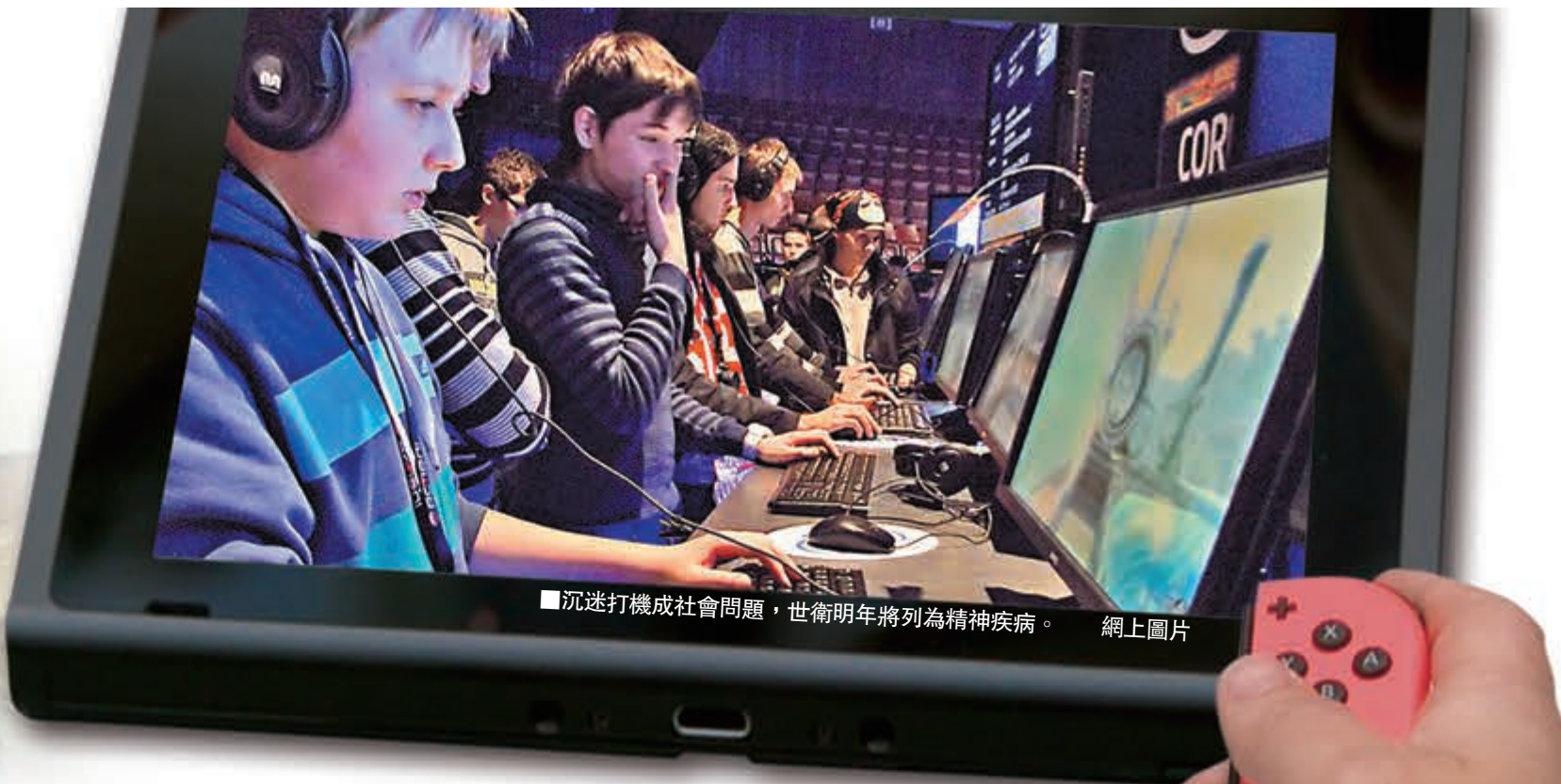
■ 沉迷打機成社會問題，世衛明年將列為精神疾病。