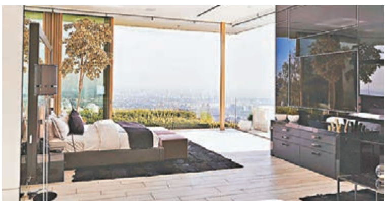
■ 豪華睡房擁無敵景觀。