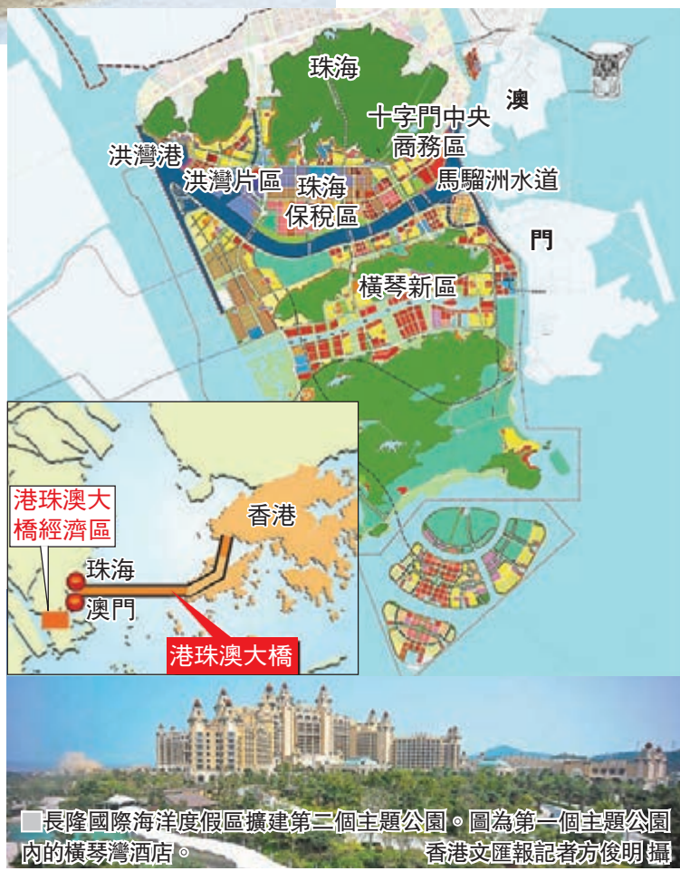
長隆國際海洋度假區擴建第二個主題公園。圖為第一個主題公園內的橫琴灣酒店。