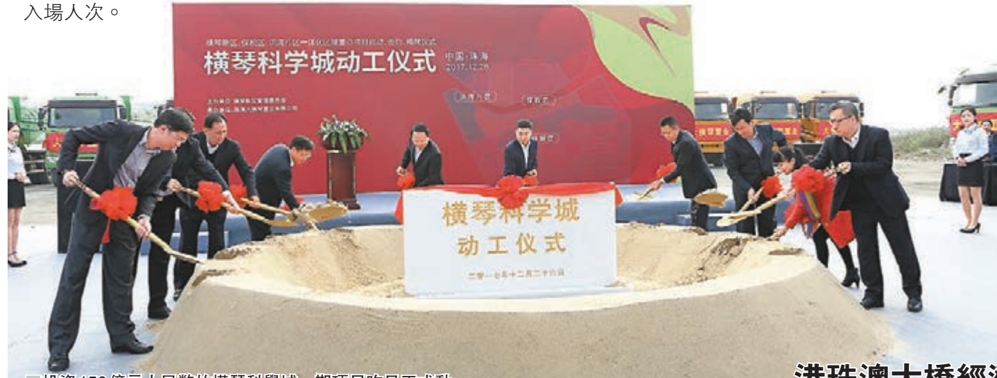
投資150億元人民幣的橫琴科學城一期項目昨日正式動工,打造現代複合科學城。

香港文匯報訊(記者方俊明 珠海報道)「橫琴新區、保稅區、洪灣片區一體化區域重點項目啟動、簽約、揭牌儀式」昨日在珠海舉行,意味著「港珠澳大橋經濟區」建設正式啟動,將打造成为粵港澳深度合作示範區。其間,27個重點項目動工簽約,其中香港財團麗新集團總投資44億元(人民幣,下同,約合52億港元),開建以保時捷體驗中心、皇家馬德里體驗中心為代表的文化項目聚集體。長隆國際海洋度假區第二個主題公園亦動工,建成後擁有每年遊客5千萬人次的接待能力,遠超香港海洋公園去年600萬入場人次。