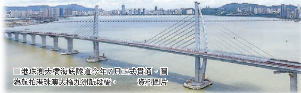
港珠澳大橋海底隧道今年7月正式貫通。圖為航拍港珠澳大橋九洲航段橋。資料圖片