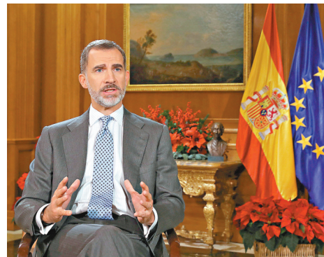
■費利佩六世呼籲加泰議員必須尊重民意的多樣性。