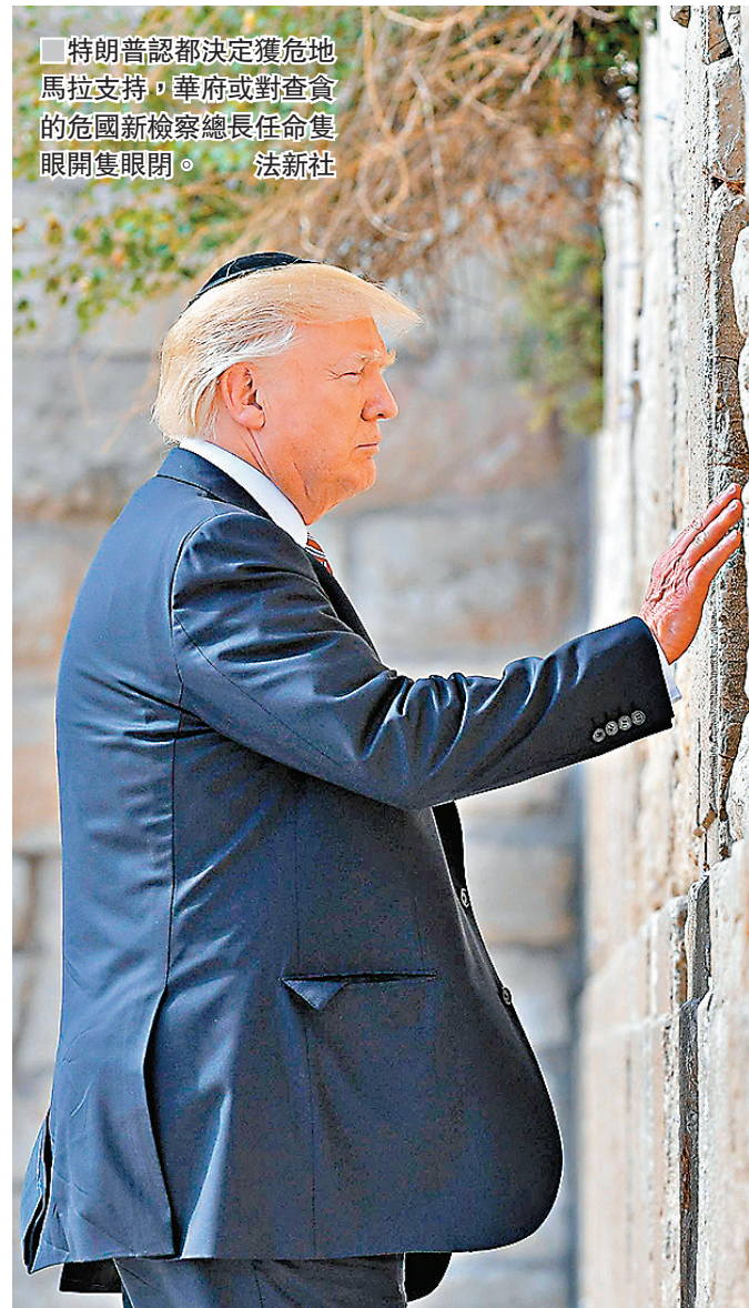
■特朗普認都決定獲危地馬拉支持，華府或對查貪的危地新檢察總長任命隻眼開隻眼閉。