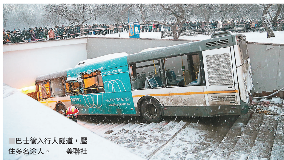
■巴士衝入行人隧道，壓住多名途人。