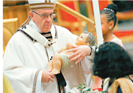
■教宗以聖母瑪利亞和聖約瑟的故事，敦促全球13億天主教徒接納難民。