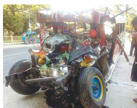
■小型巴士損毀嚴重。