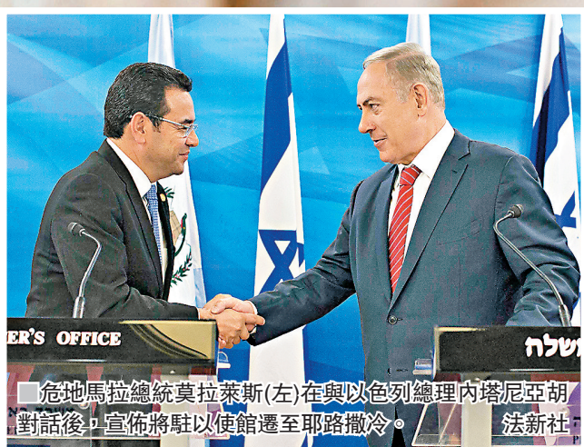
■危地馬拉總統莫拉萊斯(左)在與以色列總理內塔尼亞胡對話後，宣佈將駐以大使館遷至耶路撒冷。

美國總統特朗普承認耶路撒冷為以色列首都，引發重大爭議後，中美洲國家危地馬拉總統莫拉萊斯平安夜在社交網站facebook宣佈，在與以色列總理內塔尼亞胡對話後，下令外交部將駐以大使館遷至耶路撒冷，成為首個追隨特朗普決定遷館的國家，但未有時間表。外界認為莫拉萊斯不惜掀起外交風波宣佈遷館，是試圖討好特朗普，確保繼續得到華府援助，同時轉移各方對其涉貪的視線。