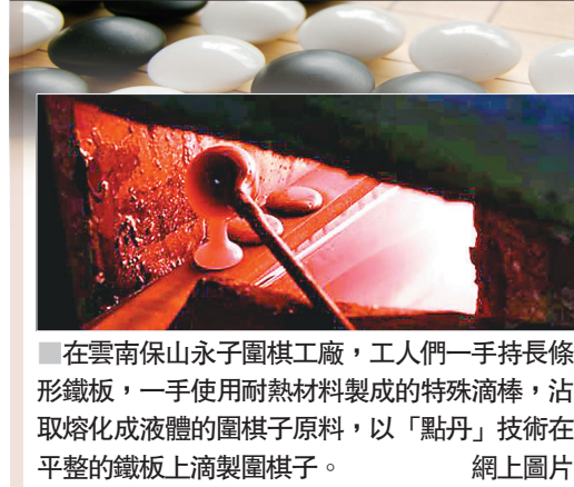
在雲南保山永子圍棋工廠，工人們一手持長條形鐵板，一手使用耐熱材料製成的特殊滴棒，沾取熔化成液體的圍棋子原料，以「點丹」技術在平整的鐵板上滴製圍棋子。