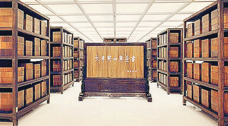
國家圖書館文津閣《四庫全書》。

國家圖書館於12月25日開啟今年的讀書周。《中華傳統文化百部經典》主題展及「文津經典誦讀」五周年回顧展同時開展，向讀者再現中華經典。