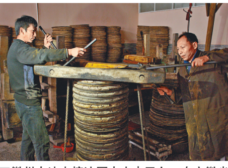
徽州古法木榨油歷史由來已久，在安徽省休寧縣的舌尖徽州木榨油坊內，工人正進行傳統古法榨油的工序。圖為榨油師傅將菜籽餅壓成餅狀。

「叮！」伴隨著榨油師傅的勞動號子和一聲清脆的金屬撞擊聲，懸吊着的鐵錘重重撞擊在一台木榨機的楔片上，餘音還在回蕩，木榨機內的600餘斤油菜籽餅，已經開始滲出金燦燦的菜籽油。